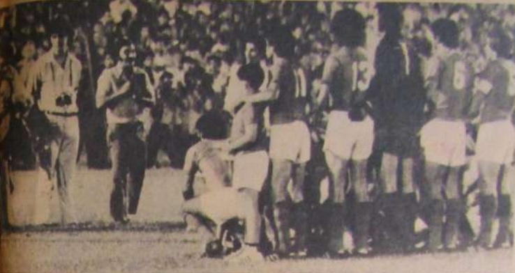
con una actuación enaltecadora. Colo Colo sufrió en carne propia lo que él acostumbra a hacer con los rivales.