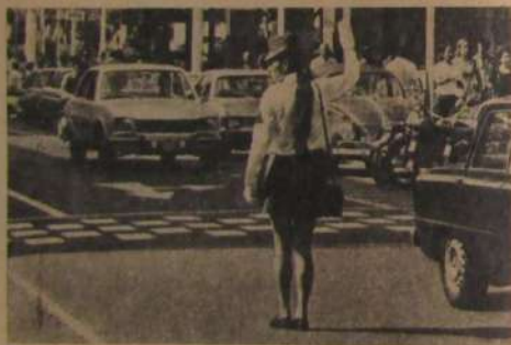
UN "ZORRITA GRIS": Pese a todo, seguimos orgullosos de nuestros Carabineros.

nada que hacer con la albirroja". Lo último que oprimos fue que el trabajo del seleccionado se paralizaba hasta el término de la Copa. Con la diligencia de que ellas tienen tiempo de prepararse hasta septiembre. Varias coincidencias, ¿no?