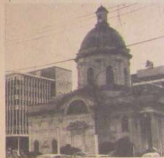
EL PANTEON DE LOS HEROES: Contraste entre lo antiguo y lo moderno.

LA ALEGRIA inmensa de Maracaná se truncho en Asunción mucho antes del partido. Fue cuando se supo que había fallecido el hermano de Héctor Gálvez. El presidente no pudo ocultar su dolor y desde ese momento ya no fue el mismo. Y los jugadores también lo sintieron. Esa noche no hubo risas en los comedores y pasillos del Gran