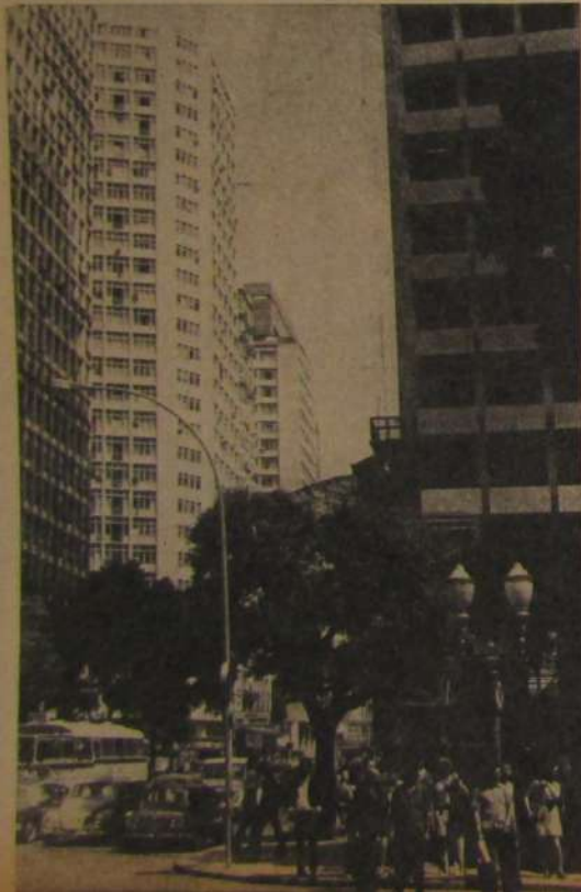
RIO DE JANEIRO: En pleno corazón de la antigua capital.

LOS ENCANTOS de Asunción están por sus alrededores. Llegué al pueblo donde se hace el "semáforo", la maravillosa tela bordada a mano; pasé por el lago que no es tan azul como dice la canción, pero que es igualmente hermoso. Y al centro de la alfarería po-