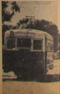
LA PLACIDEZ DE ASUNCIÓN: El tránsito, todo un símbolo.