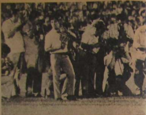
EL CICLON: Así le dicen a Cerro Porteno. Y lo justificó ante los albos.

Y A PROPOSITO de estadísticas. Con Amara, director técnico de la selección paraguaya, está ocurriendo casi lo mismo que con Gurendel en Chile. El problema de allá es similar al nuestro. Un solo equipo —Cerro Porteno— tiene a otros jugadores seleccionados (días sueltos y sus aseres) y también se produce conflicto entre los intereses del club y la selección. Además, Amara sigue llamando "a gente que no tiene