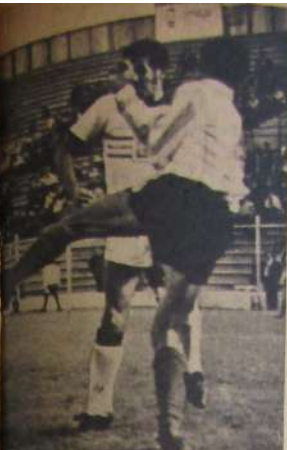
EN EL ENTRENAMIENTO: La misma responsabilidad que en la cancha.