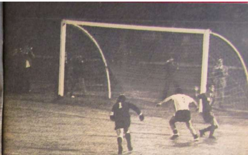
camino, finto a Piriz que se había recuperado y se le cruzó, haciéndole seguir de largo y finalmente llegó a la línea con el balón, luego que García fracasara en dos intentos de agarrarlo.