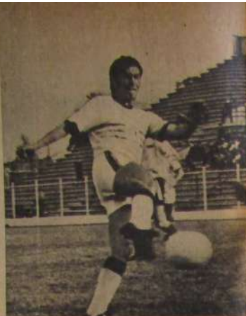
EN LOTA-SCHWAGER: No todo lo hacía Diéguez.