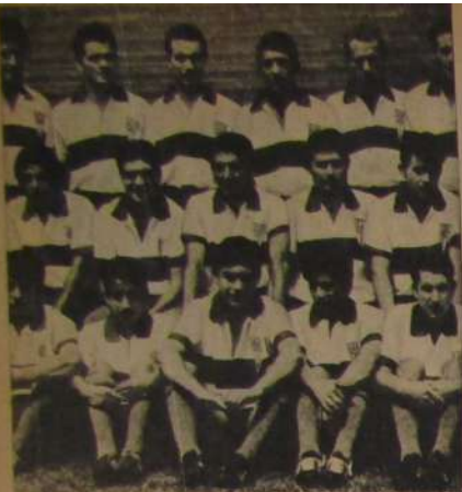
EN U. CATOLICA: El de medio en la fila de abajo. Portada de ESTADIO "sin saber leer ni escribir".