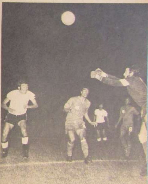
ANTE LA PRESENCIA del codicioso Ahumada, García opta por rechazar con los puños. El arquero quedó expuesto a la "voracidad" de los atacantes de Colo Colo.

CASZELY, resistiendo la carga de Piriz. El puntero albo, que apareció por todos lados, superó sistemáticamente en velocidad a la defensa ecuatoriana.