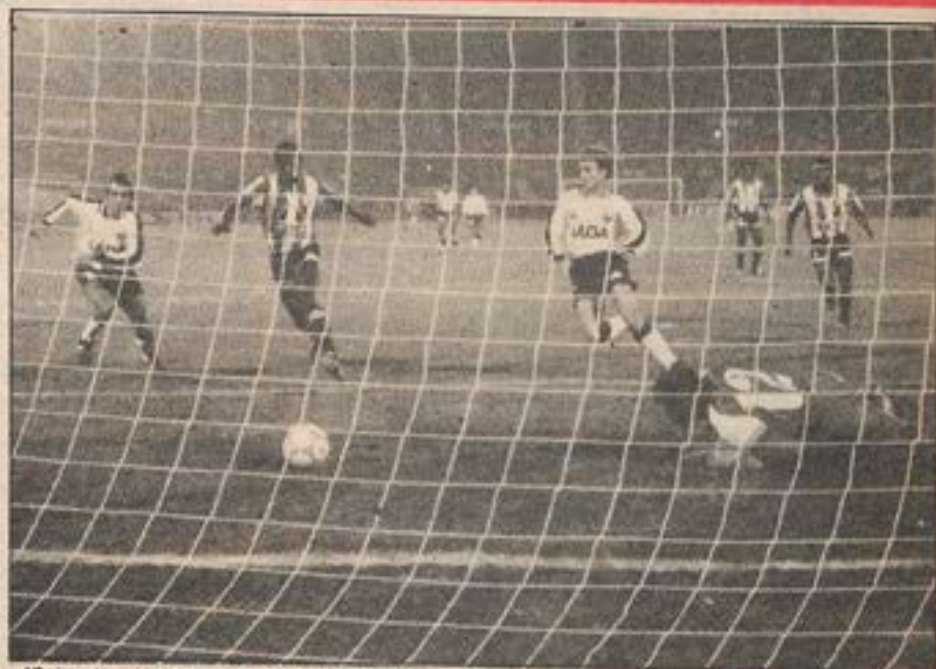
15 de mayo de 1990: Colo Colo 3, Unión Huaral 1. Último triunfo de los albos sobre los peruanos en la Copa Libertadores.

En 42 partidos coperos, los equipos nacionales han establecido superioridad sobre los representantes del país vecino. Con Universitario al frente, Colo Colo tiene el respaldo de la historia y el aval del presente.