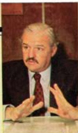
Por FERNANDO NIEMBRO (*)