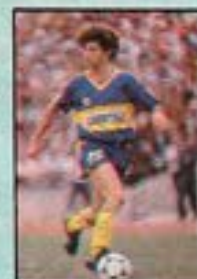
PICO (Boca Juniors) 6,33