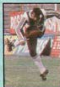
CRUZ (Chaco) 6,66