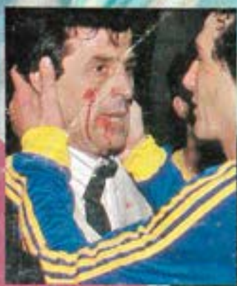
La sangre de Tabárez.