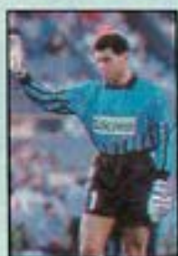
GOYCO-CHEA (Racing) 7,00

De los 322 jugadores utilizados, éstos son los mejores en cada puesto. Debieron ser calificados en los tres partidos.