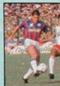
CARRIZO (San Lorenzo) 6,66