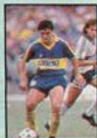
SOÑORA (Boca) 6,33