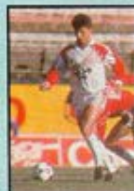
BORGI (Huracán) 7,66