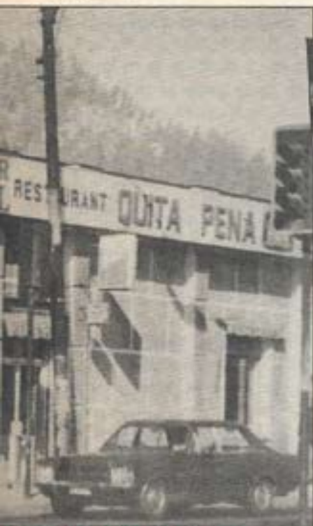
, se mantiene con el paso