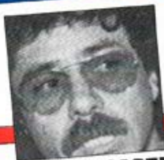
CARLOS CASZELY Delantero