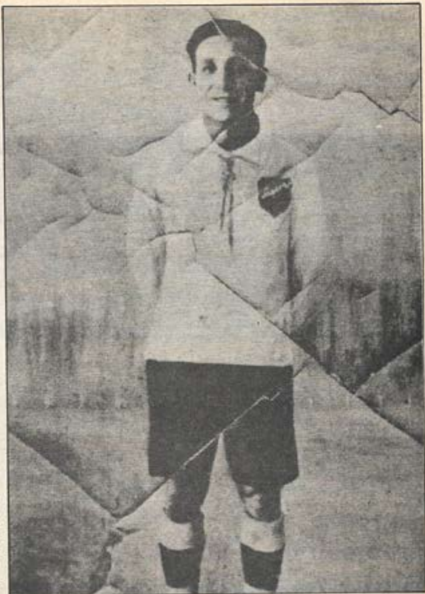
La imagen de David Arellano grabada sobre el cuero de una pelota de fútbol.

Y comienza a perfilarse lo que toda la hinchada deseaba. Porque, el otro equipo ecuatoriano, Emelec enfrenta de la misma forma al conjunto albo y cae por la cuenta de 5-1: Valdés a los 43' de la primera etapa, Messen a los 09', a los 14' Ahumada, 29' y 43' del segundo tiempo Cazsely, estructuraron este contundente marcador, que le daba el paso a semifinales. Y así vino la jornada de Maracaná, con Botafogo como rival de turno. Los brasileños que habían entrado a matar alentados por su hinchada, que fue enmudeciendo poco a poco, al ver al equipo albo desarro-