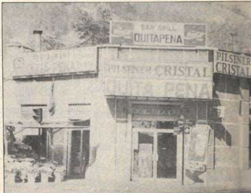
La tradicional ubicación del antiguo bar Quitapenas, donde nació Colo Colo de los años.

En sus 67 años de existencia, Colo Colo ha experimentado todos los avatares de la vida, grandes triunfos deportivos, son matizados con frustraciones en logros de-