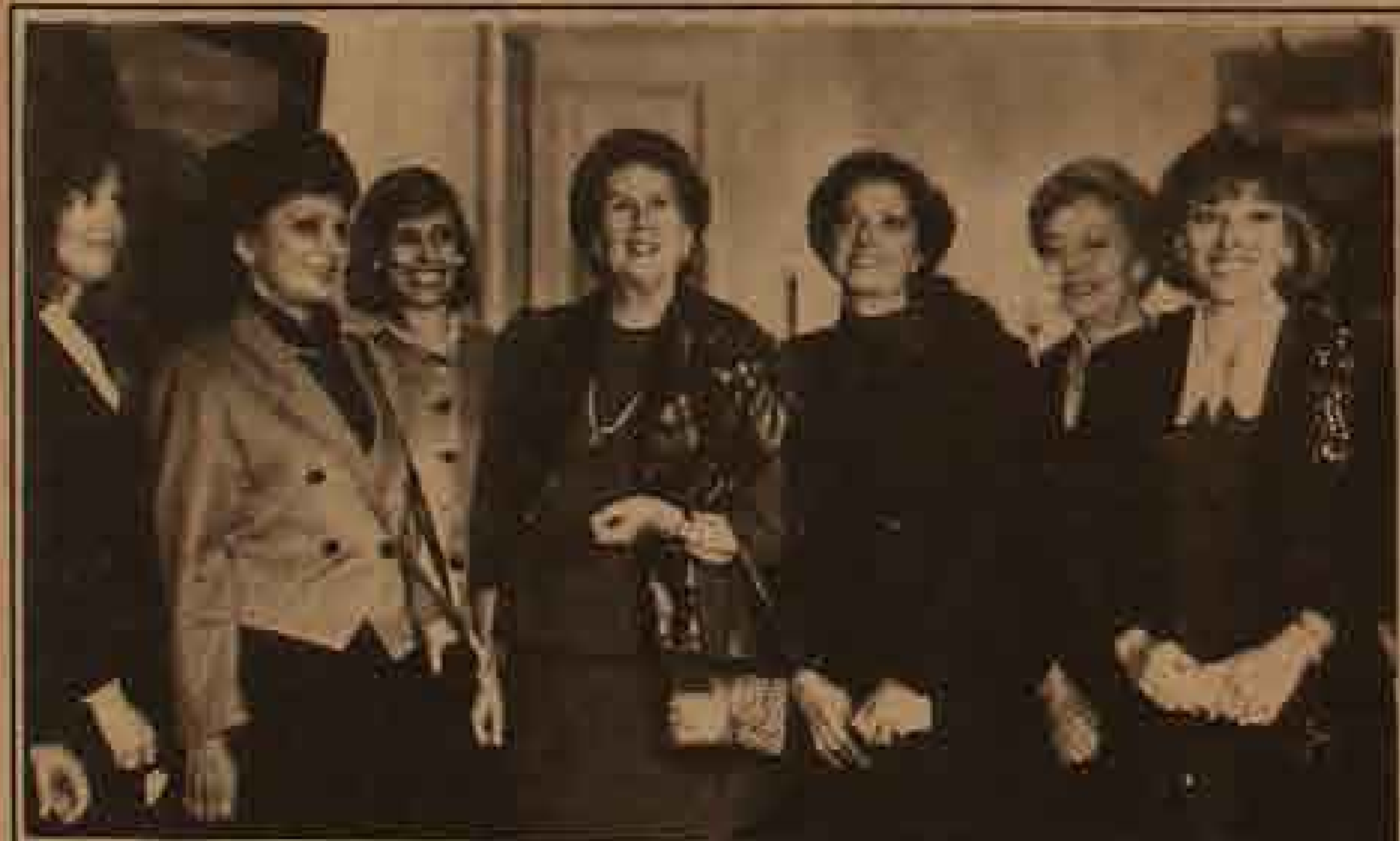
Doña Leonor Oyarzún de Aylwin se reunió ayer en La Moneda con las esposas y jefes de delegaciones que asisten a la OEA en la capital. En la foto aparece con algunas de ellas.

"Es verdaderamente muy importante para nuestros países que todos estemos reunidos, porque los países latinoamericanos tenemos raíces comunes. Tenemos que incentivar las relaciones amistosas que tenemos entre nosotros, porque así todos juntos vamos a levantar América Latina", dijo la señora del Presidente de la República a las esposas de los cancilleres y jefes de delegación que asisten a la XXI Asamblea General de la Organización de Estados Americanos, OEA, al referirse a la importancia que tiene la celebración de esta reunión para todos los países miembros.