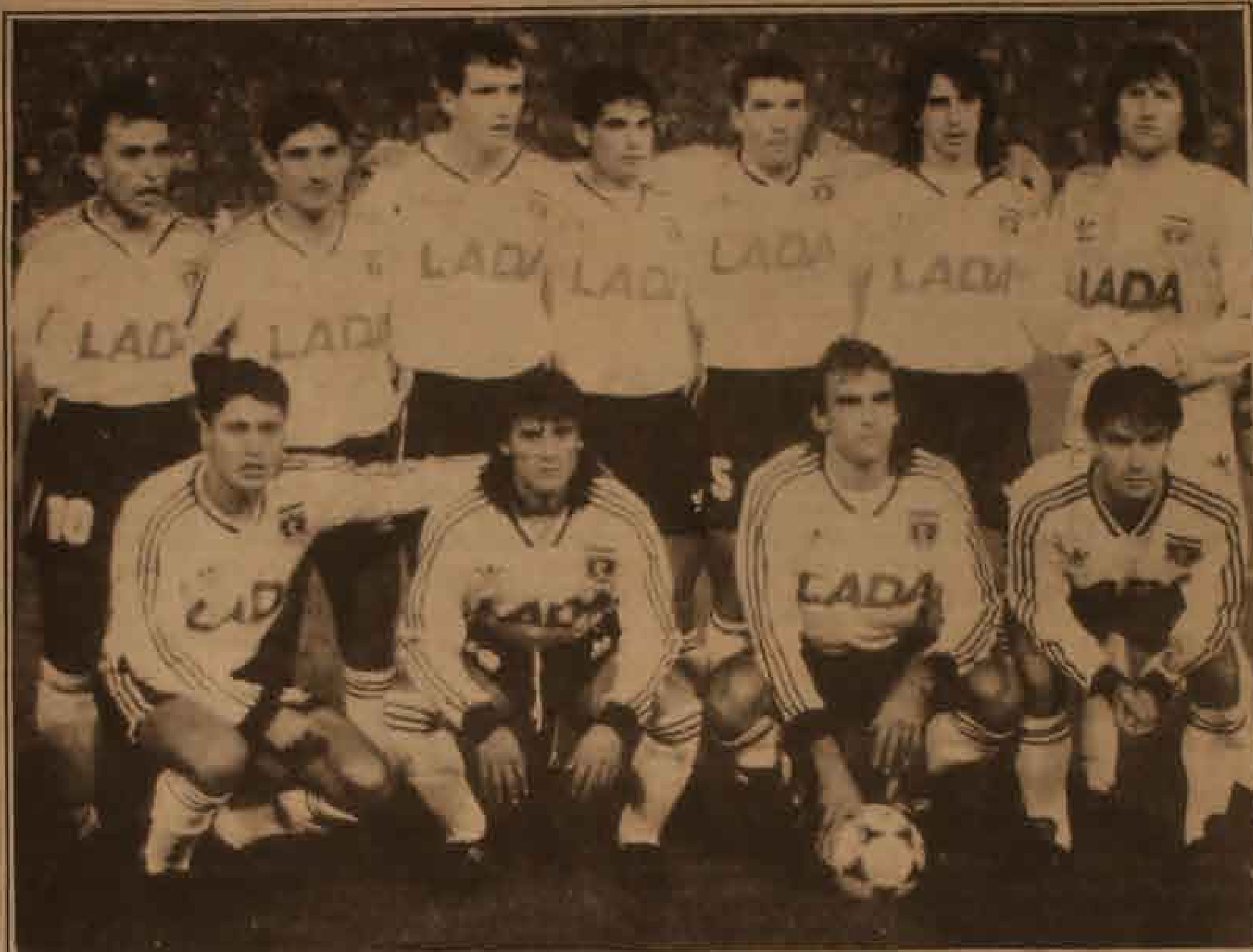
Colo Colo sale con todo esta noche a asegurar la Copa. En la foto, el cuadro que empezó las grandes victorias de la fase de finales, venciendo 4 por 0 a Nacional, de Uruguay

Arbitro brasileño llegó tranquilo el "gau"