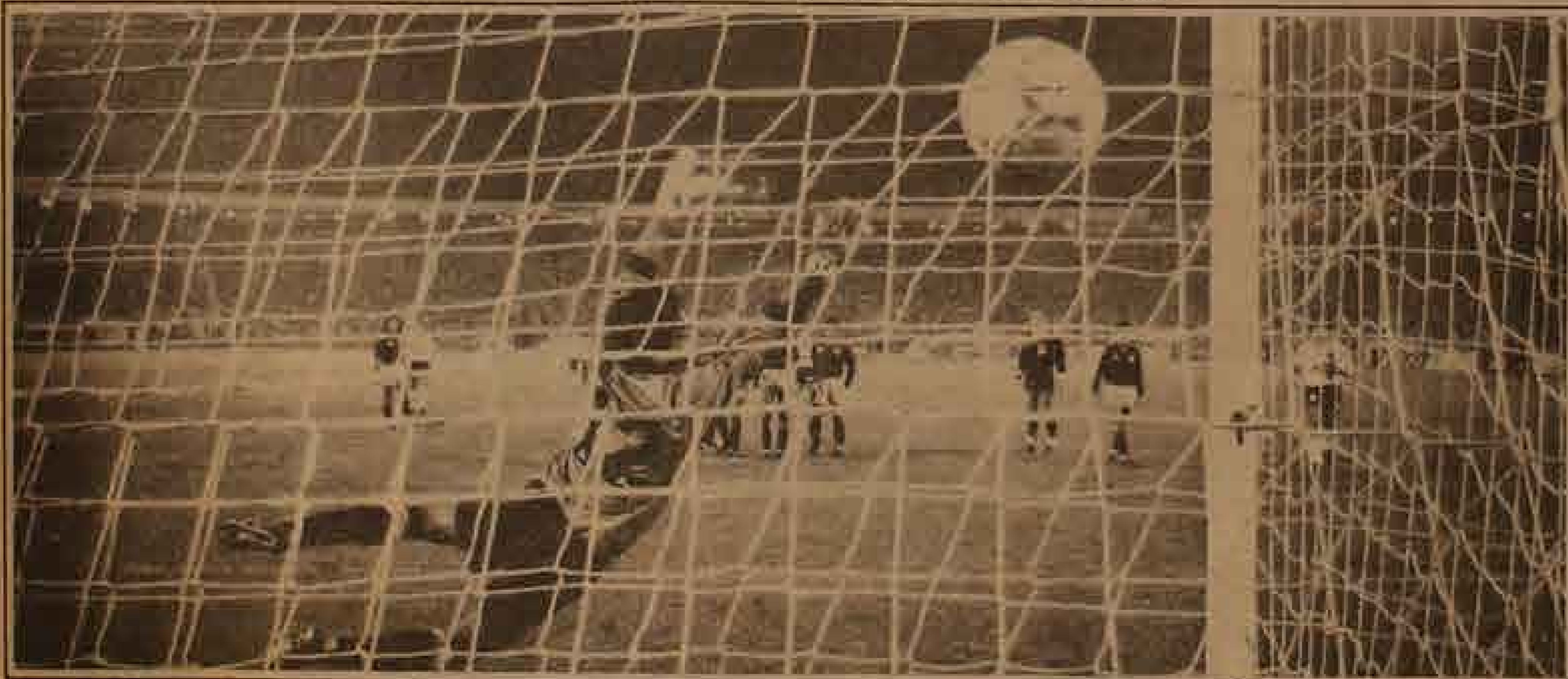
El gol es la esencia de esta hermosa "pasión de multitudes"

"Dejé grandes y buenos amigos en aquel paso por Chile. Lo mejor de Chile es su gente. Y a la gente chilena que me recuerda yo siempre la llevo en el corazón. Ahora espero que el partido contra Colo Colo no perturbe ni empañe los sentimientos de la amistad afectuosa que ambos -por lado y lado- sentimos los unos por los otros".