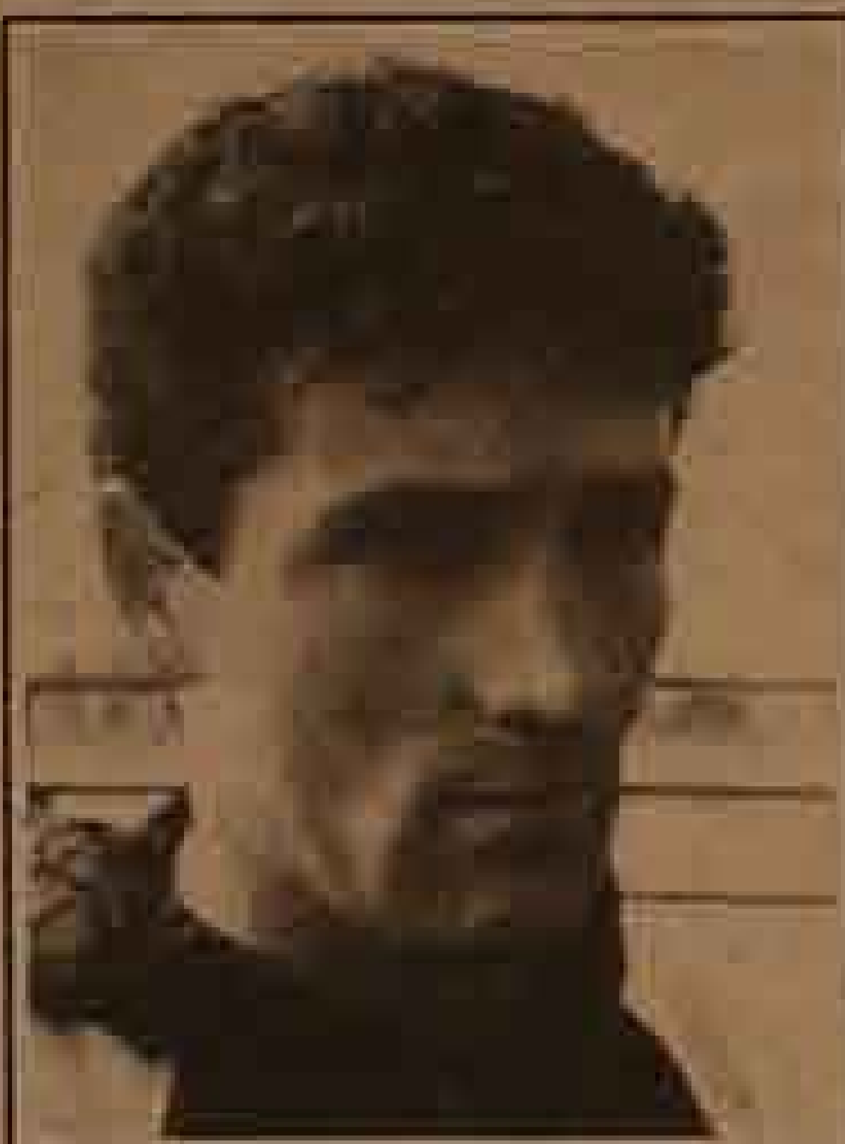
Eduardo Vilches, Tauro

En el "Quitapenas", Colo Colo vio la luz un 19 de abril de 1925. La criatura dio sus primeros pasos con tímida presencia en las canchas. Pero estaba destinada a ser campeona. Nació bajo la constelación de Aries. Su planeta regente es Marte, del dios de la guerra y los triunfos sobre la adversidad. Su color, el rojo. Al igual que la sangre de la raza mapuche, valiente y tenaz. Los nacidos en este día poseen una asombrosa voluntad y presencia magnética, lo que los predispone al éxito Monumental. Su signo es representado por el macho cabrío, símbolo de la potencia viril en la antigua cultura griega. Los perfumes fuertes, como el clavel, le son favorables. Sus lugares preferidos son los campos de batalla, donde se convierten en protagonistas y héroes. Los rige la cabeza, el cerebro, los ojos y los oídos; lo que les permite tener tiro, cancha y lado para la victoria. El macho cabrío se viste de blanco y es enormemente competitivo y osado para arriesgarse. Está todo el año en cada hoja del calendario. Colo Colo, pueblo, triunfo y corazón.