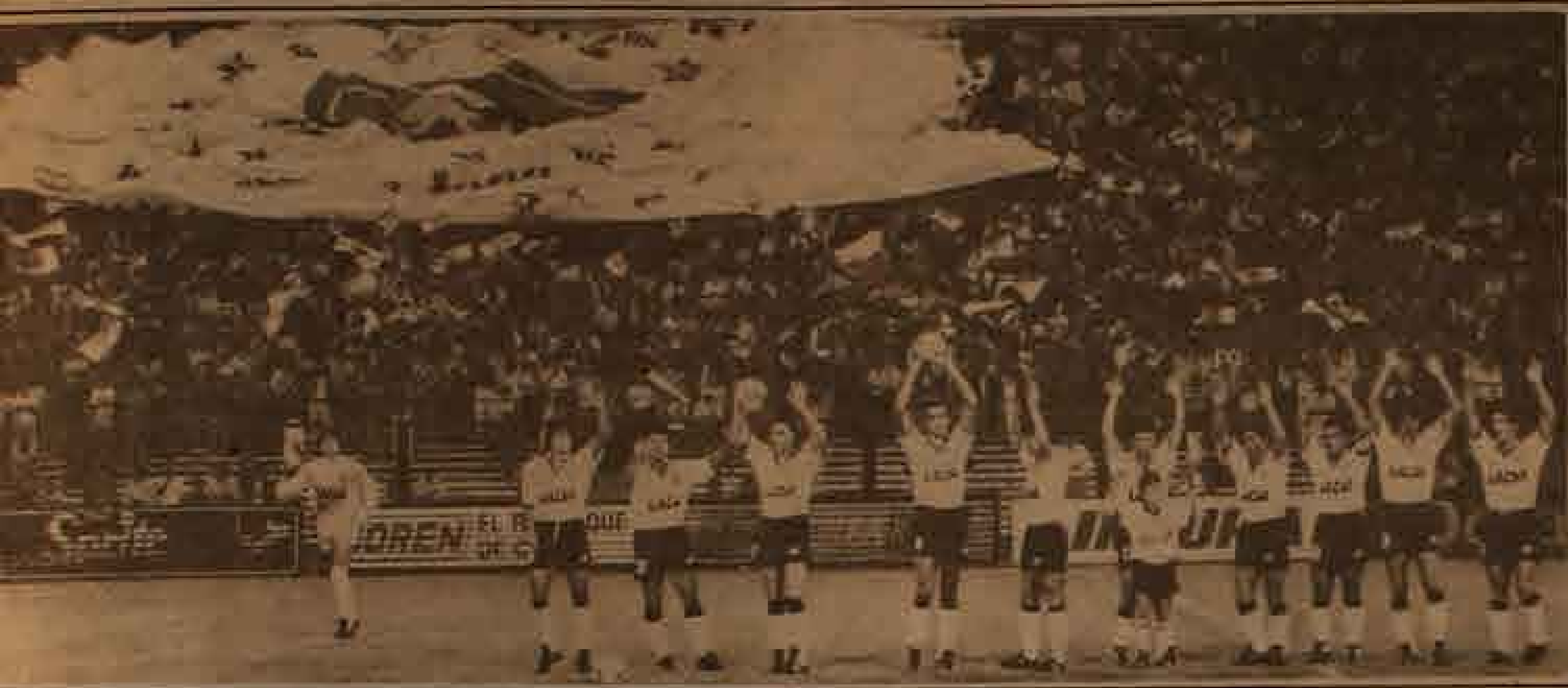
Colo Colo celebra. Signos zodiacales desnudan su mentalidad ganadora