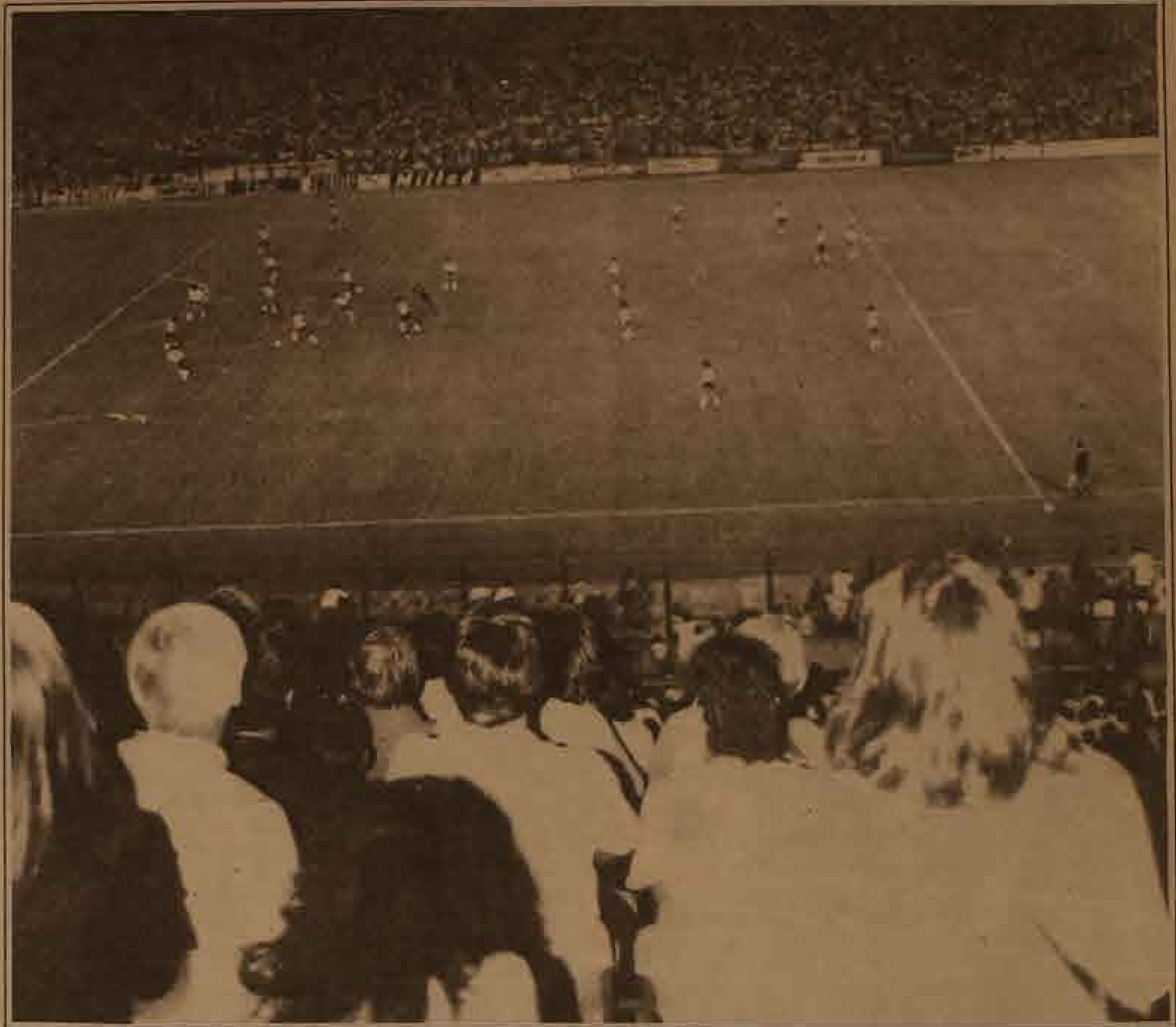
Esta noche, la fiesta del fútbol vuelve al Monumental

Argentinos y brasileños pueden discutir este nuevo esquema de los buenos y los malos del fútbol sudamericano, pero sirvanse abrir un hueco, para que nos pongamos entre los mejores, codo