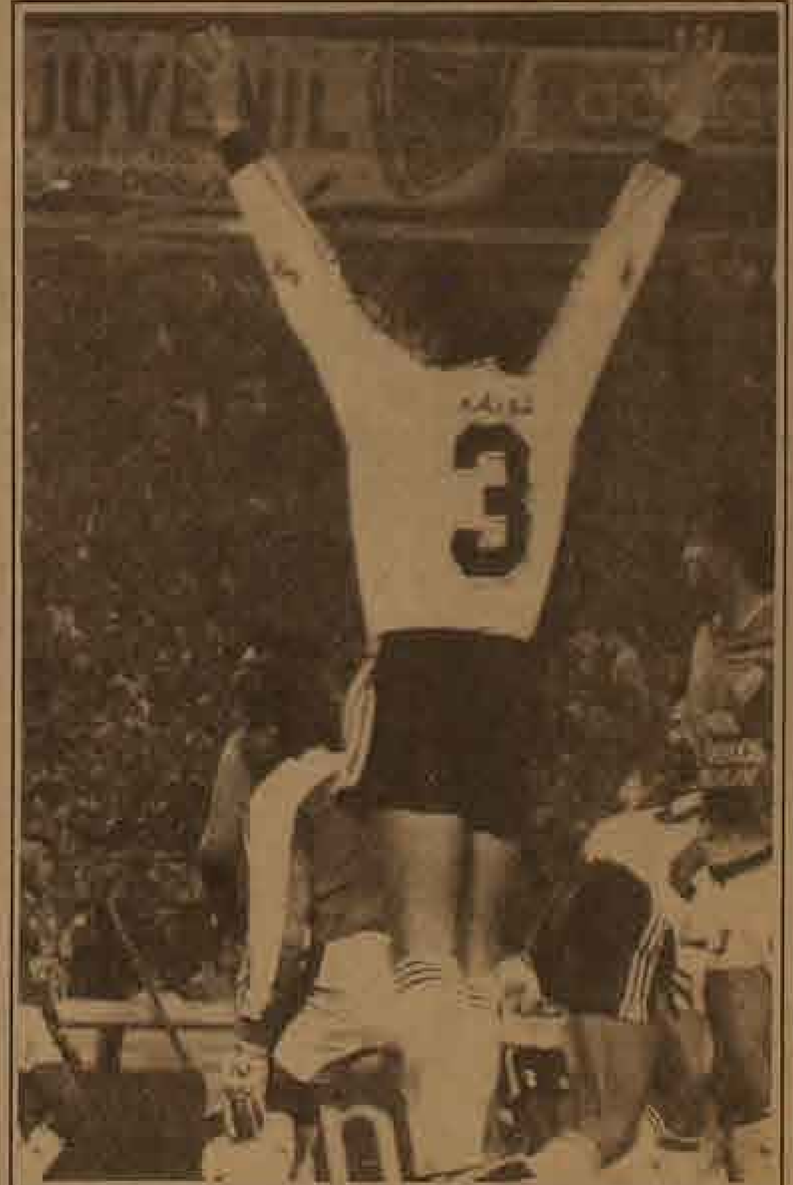
La valla rival ha sido vencida y hay que exteriorizar la alegría