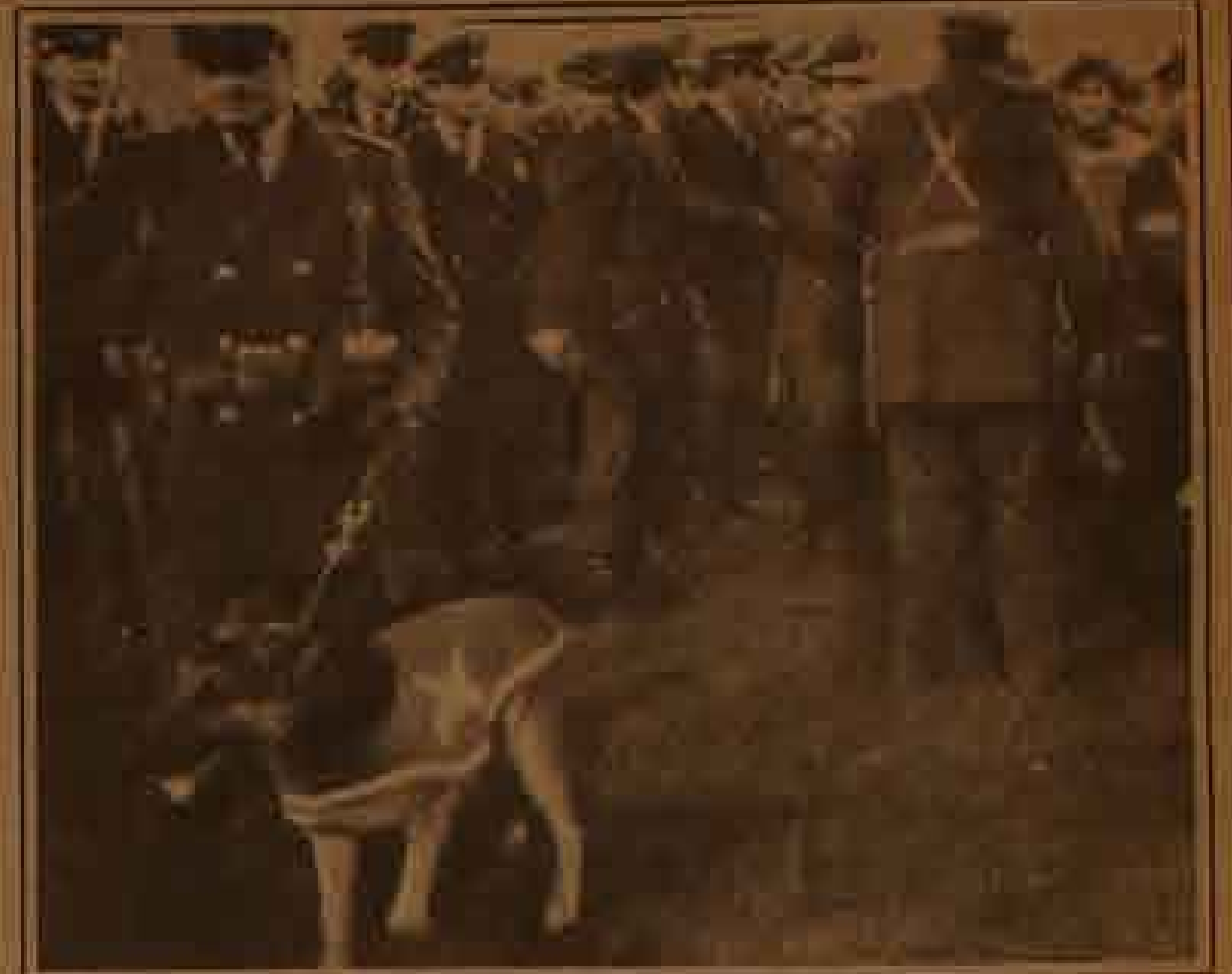
Rhon, el Can que se lució en el Monumental y a nombre de la decencia nacional, le mordió el popín a Navarro Montoya

Y Rhon se despidió con un langüetazo y se fue meneando la cola, más contento que quiltro con pulgas. Nuestro reportero, Juan Can Dado, más feliz que esquimal con guatero, regresó al diario en la limusina de Fortín y nos entregó esta exclusiva que entregamos a nuestros astutines lectores.