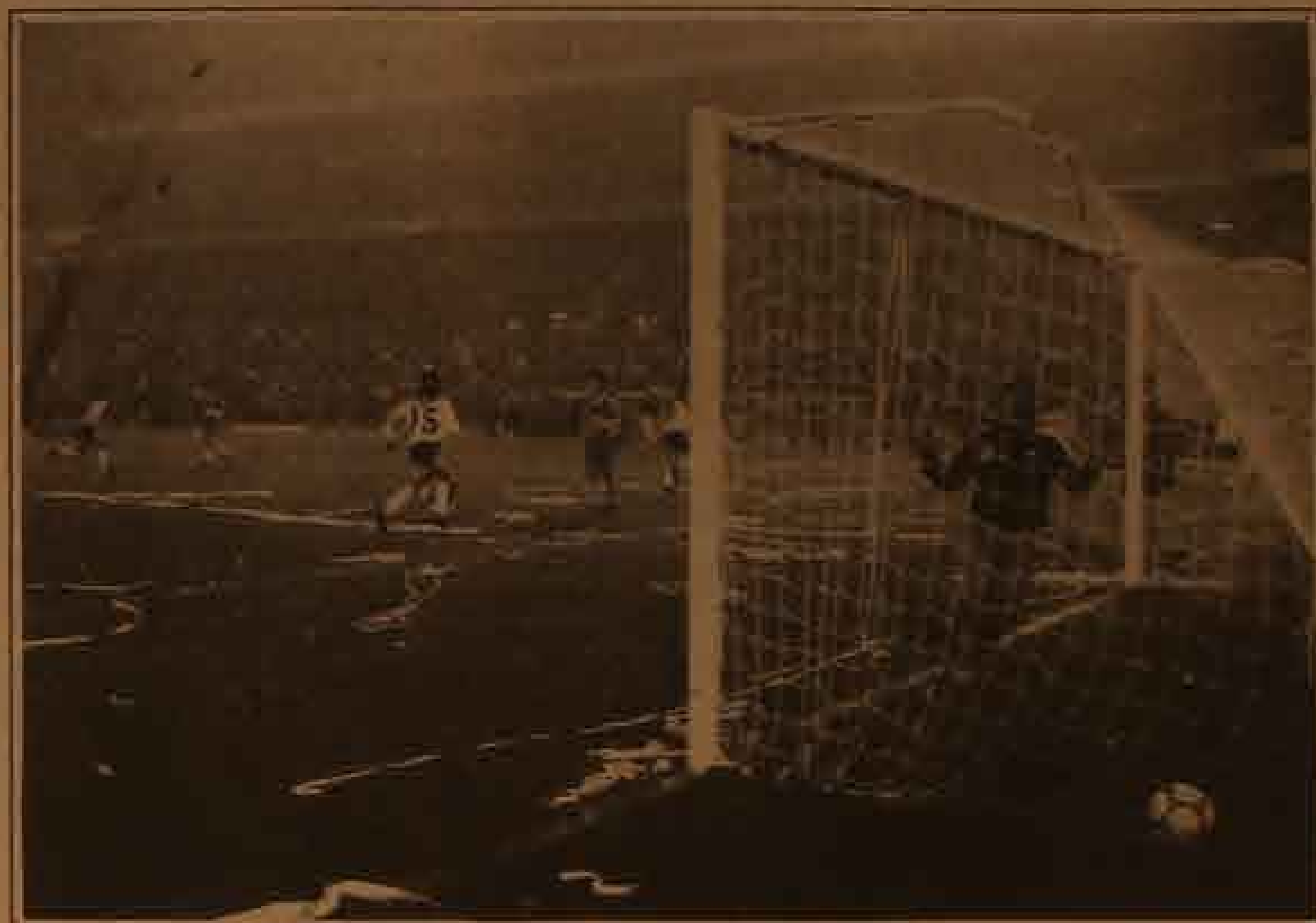
Gol de Colo Colo, equipo que se impuso en la cancha. Boca, derrotado, quiere ganar en secretaría

Fortín, horadando en los entretelones del match del Monumental, conversó con gráficos de todos los pelajes. Cierta que hubo impropiedades para el meta Navarro Monto-