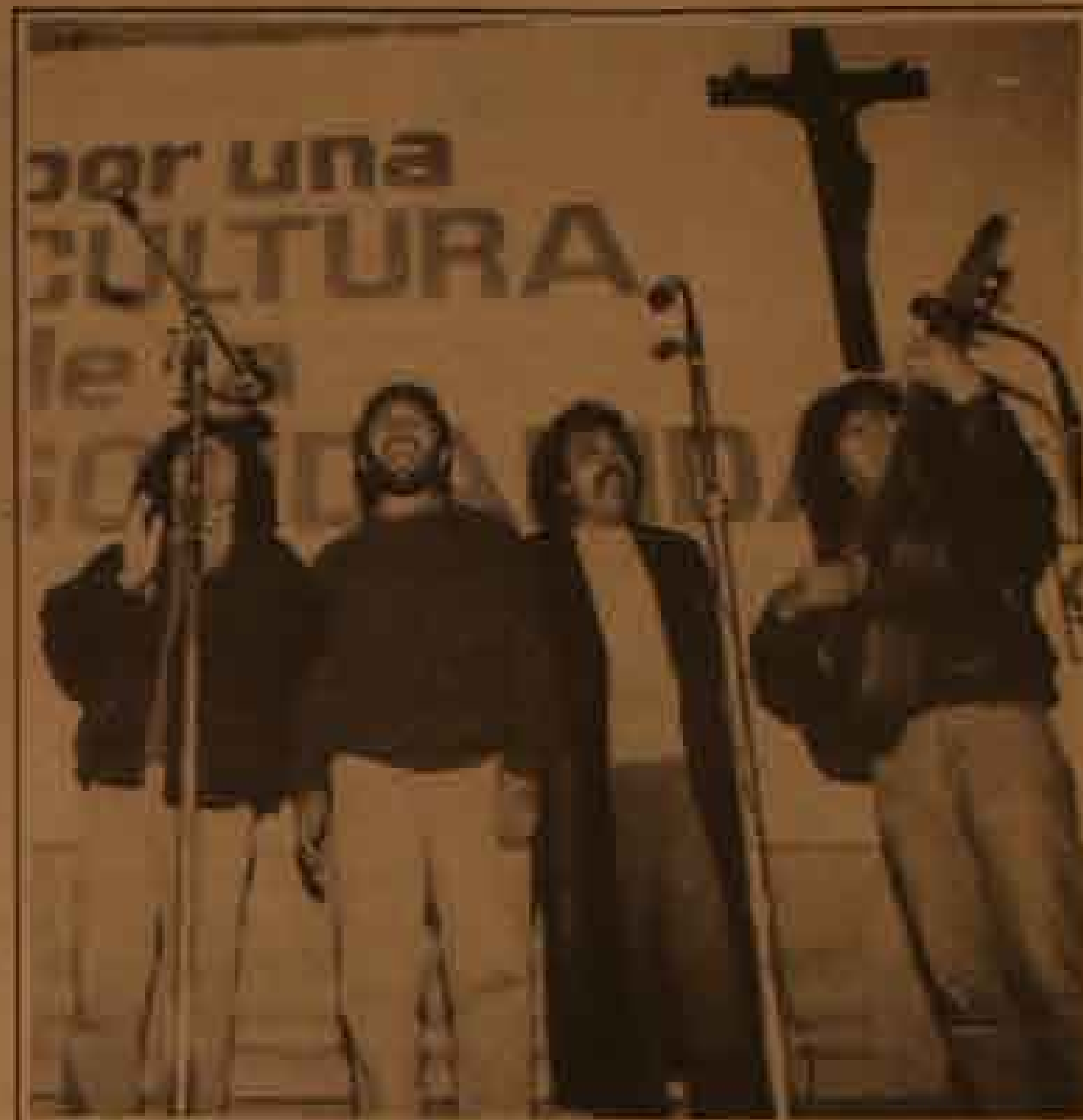
Illapu postergó para el sábado su recital en el Estadio Chile, donde le cantará al amor y a la vida. Hoy estarán gritando frente al televisor por el Colo

Suerte al Colo Colo y a disfrutar con Illapu en el Estadio Chile el próximo sábado, a las 21 hrs.