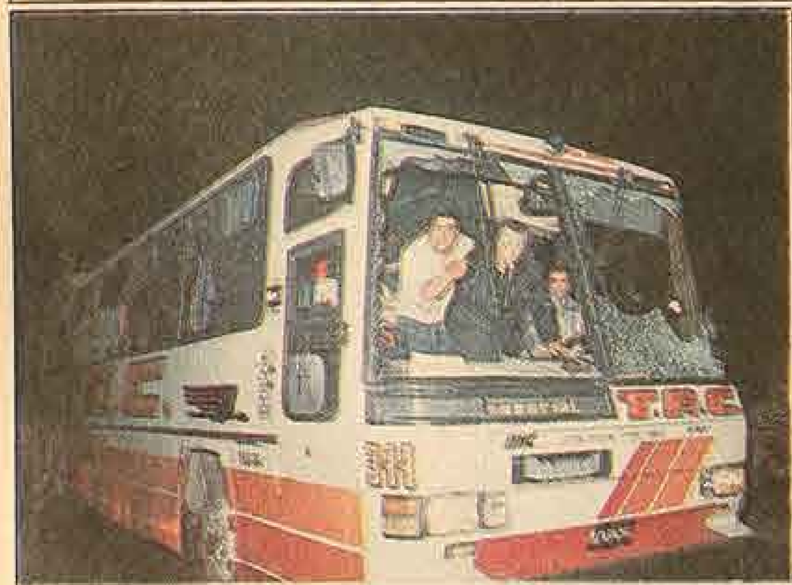
UN BUS DE hinchas argentinos fue apedreado anoche por enfurecidos partidarios de Colo Colo. Carabineros debió protegerlo con personal de caballería.