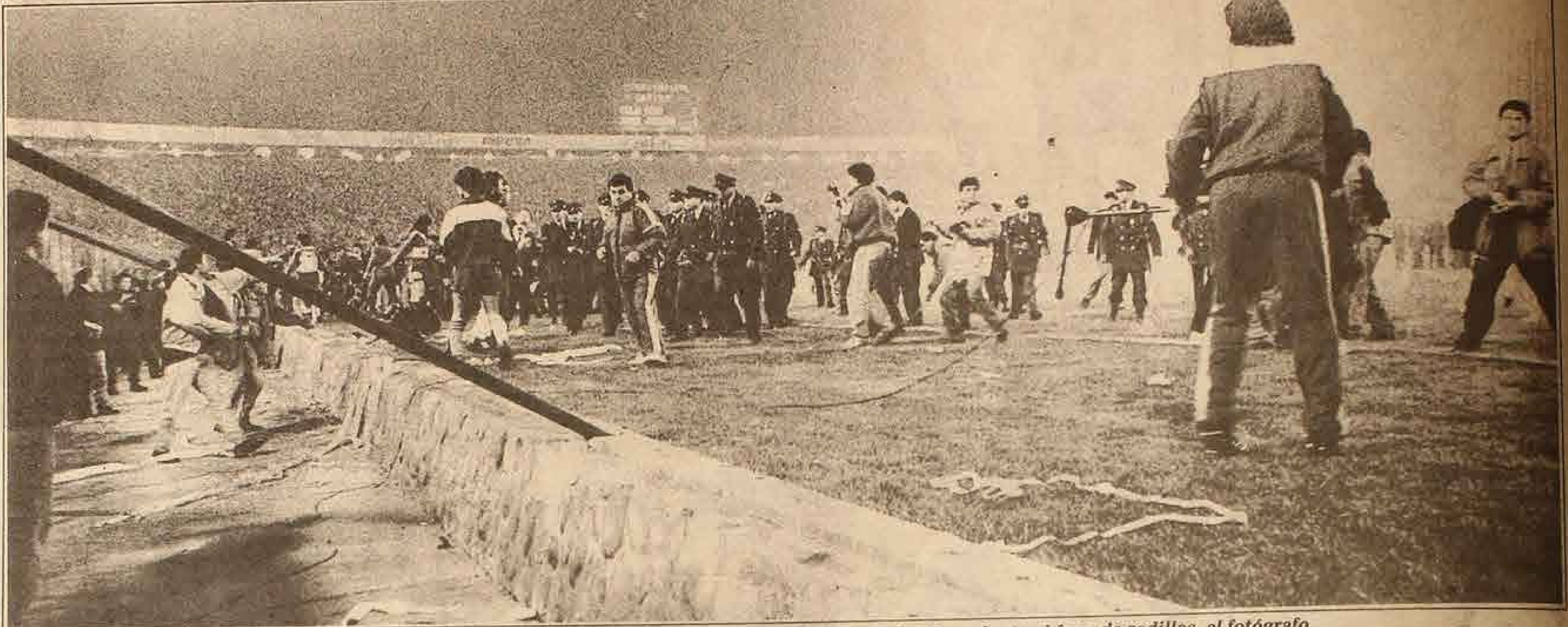
LOS INCIDENTES se generalizaron y un jugador de Boca (de espaldas) esgrime el pedestal de un micrófono. Junto al foso, de rodillas, el fotógrafo Rodrigo Arangua agredido por los argentinos.