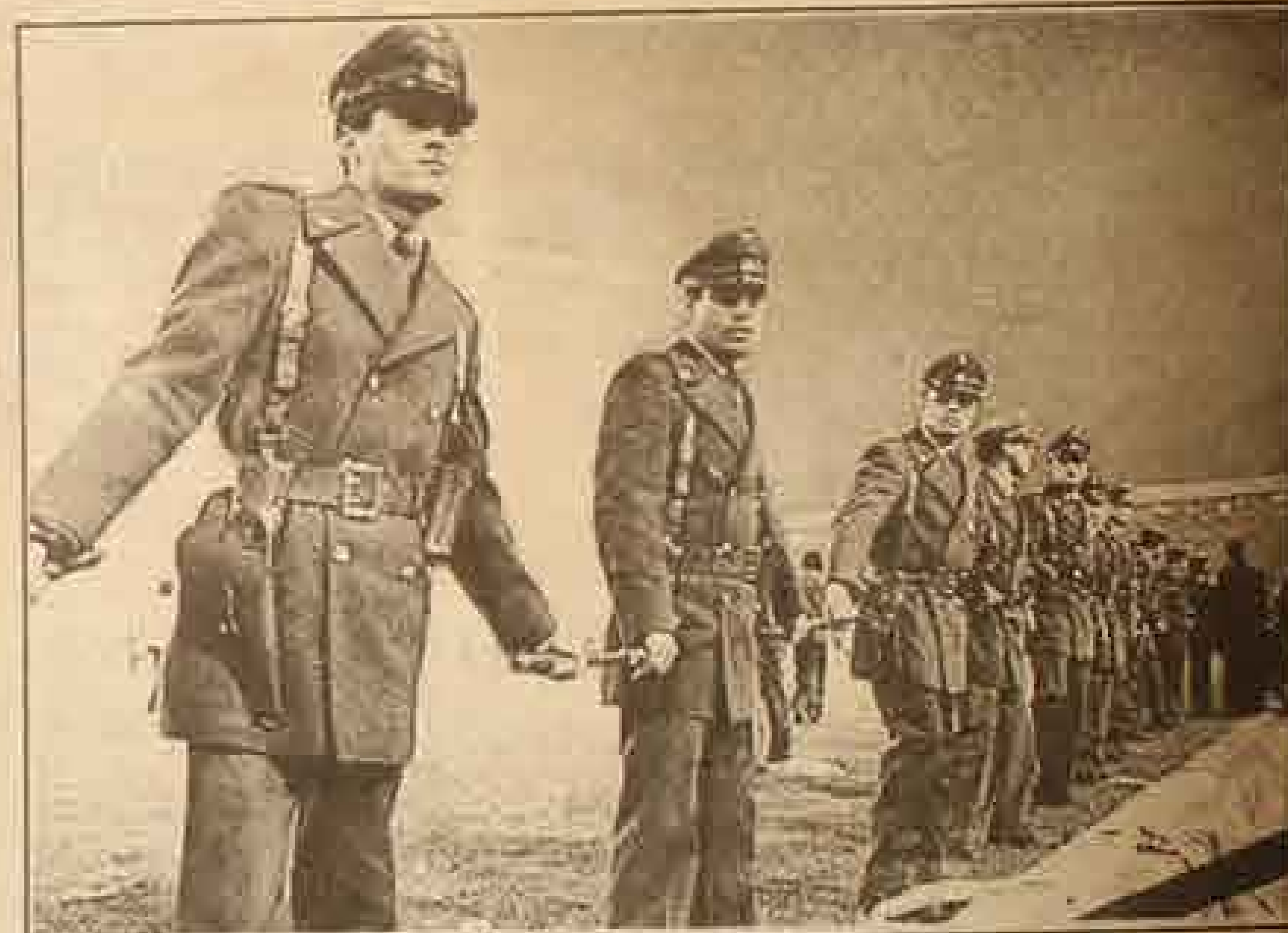
CARABINEROS tuvo que formar una muralla humana para parar los incidentes.