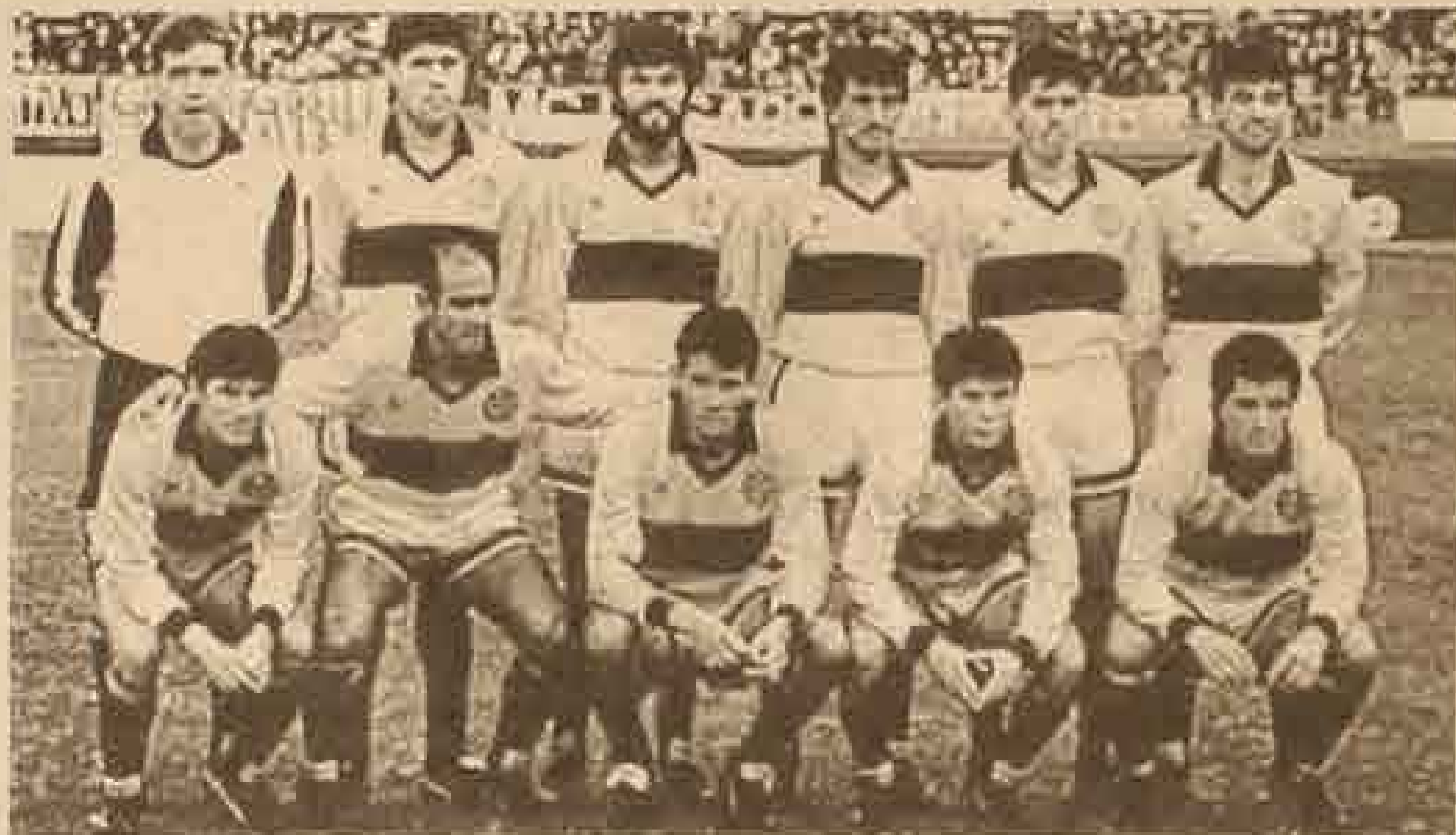
Olimpia, recibe esta noche a Nacional, de Colombia. Debe ser rival de Colo Colo en la final, el 29 y el 5, en Santiago.

Olimpia, ya lo ganó todo. Fue campeón de América. En la banca el téc-