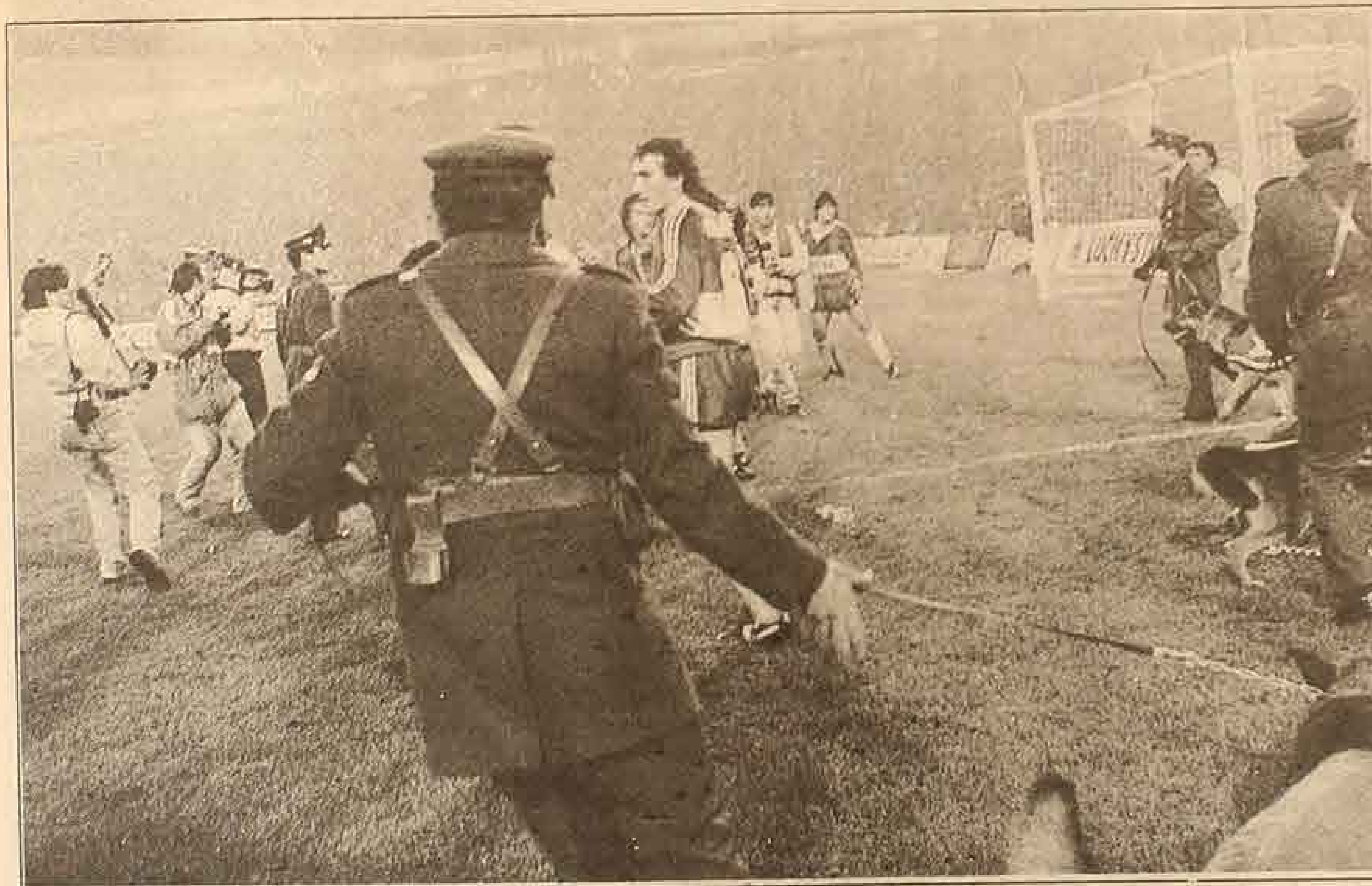
CON LOS perros tuvieron que aislar a los jugadores argentinos que querían seguir la gresca.