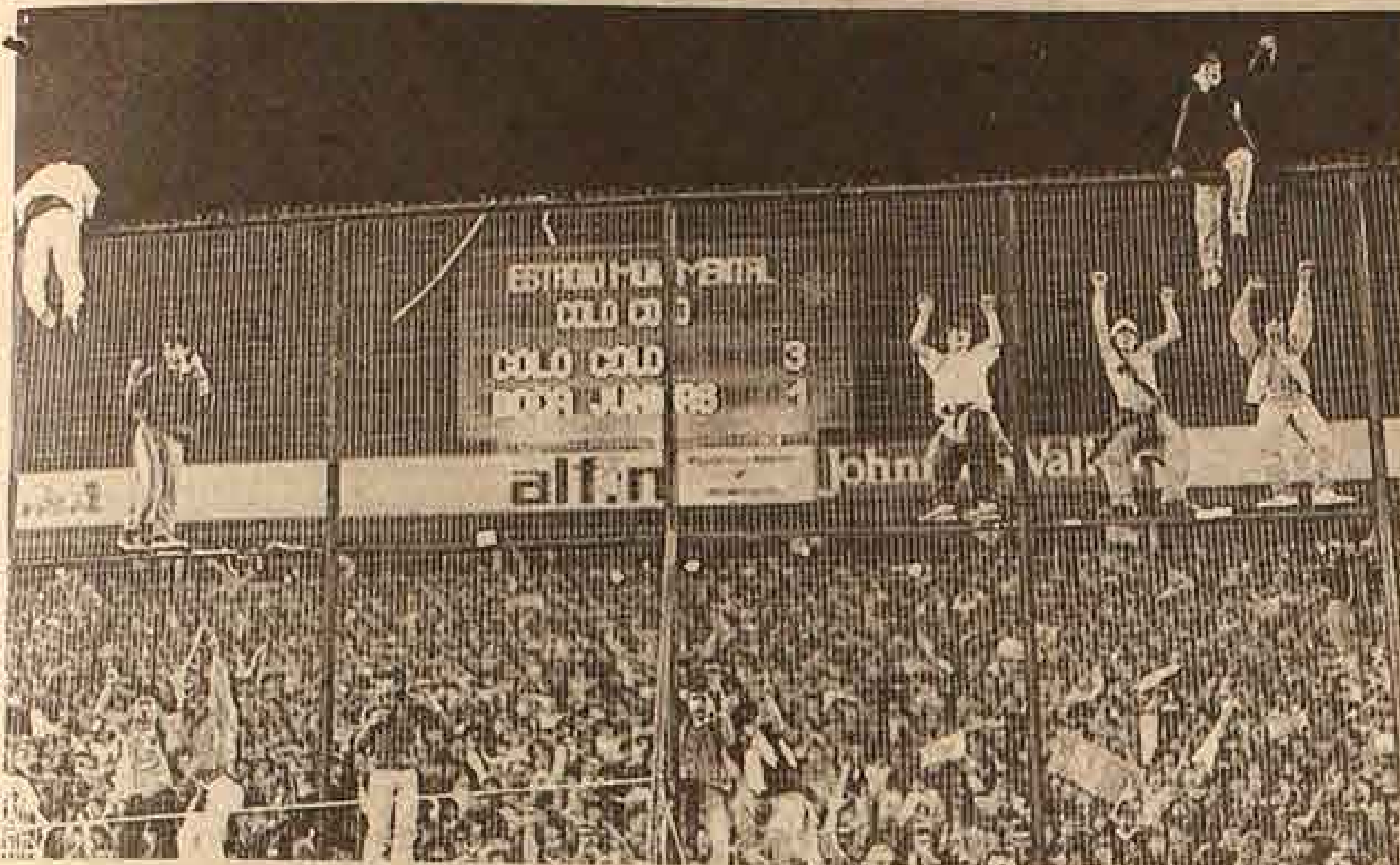
Colo Colo ya es finalista, los hinchas, se toman la reja, el marcador, para la historia: Colo Colo 3 —Boca Juniors 1.