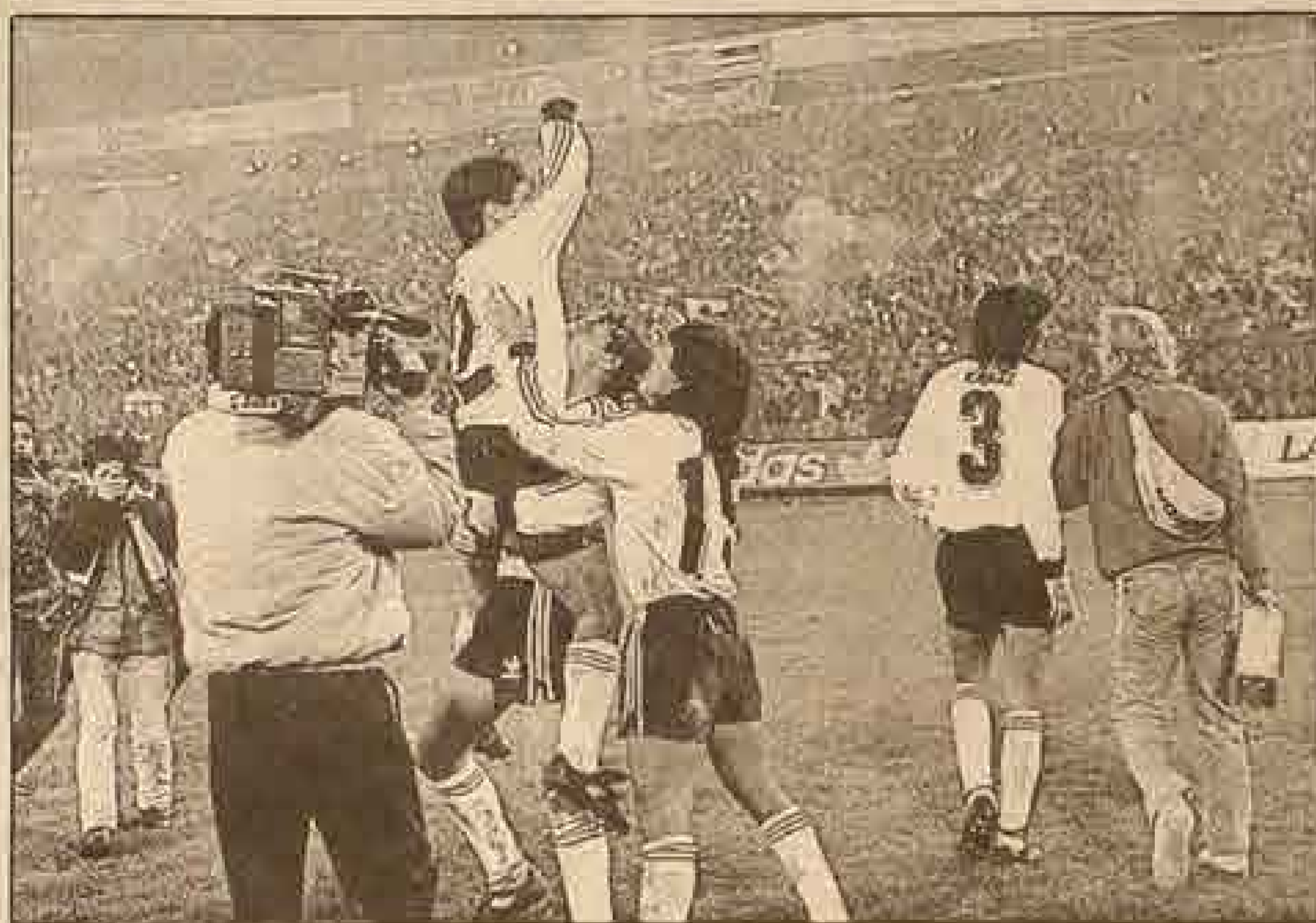
Ojalá Colo Colo continúe celebrando...