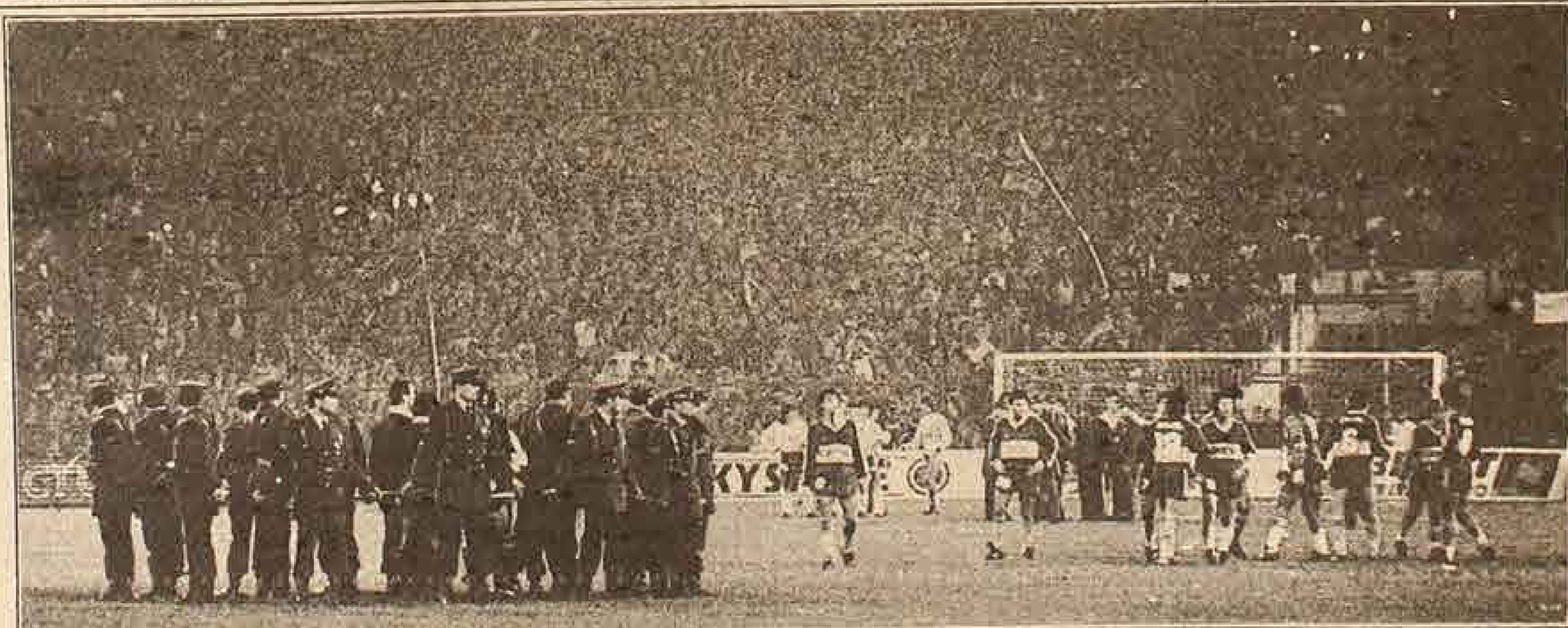
EL ARBITRO y los guardalíneas fueron protegidos por un cordón de carabineros, evitando que los jugadores se acercaran a ellos.