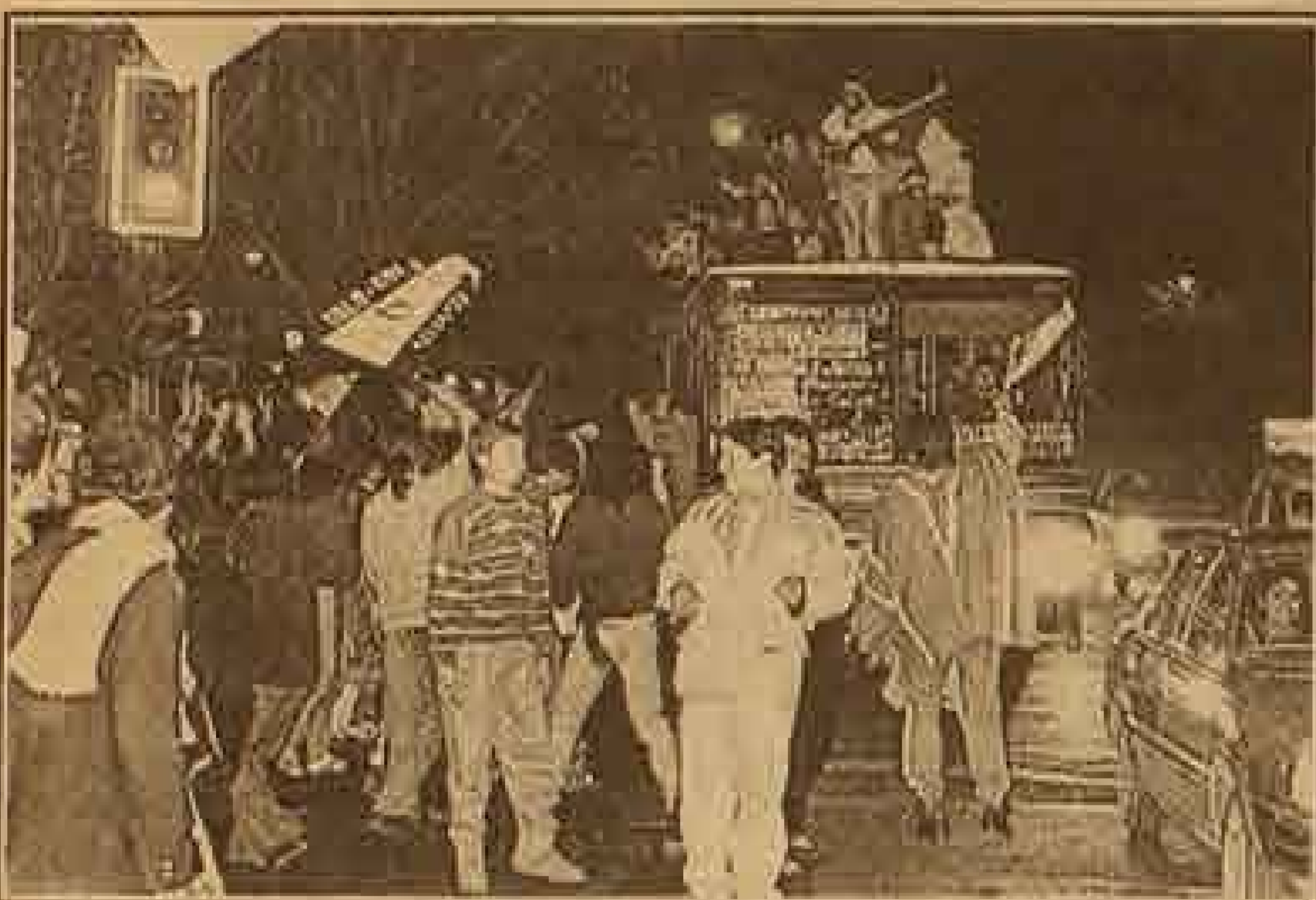
Una verdadera fiesta vivieron anoche los miles de colocolinos que asistieron al Monumental. "Ya somos campeones", gritaban en un adelanto de la final.

La Avenida Vicuña Mackenna se atochó, esta vez no por la lluvia, sino por el carnaval que siguió por Plaza Italia. En las poblaciones populares y en las del barrio alto se dio paso a los ritmos tropicales, al destape de botellas y nadie pudo sustraerse a la alegría de estar nuevamente en las finales de la Copa Libertadores de América. Las mismas escenas se repetían en todas las ciudades pequeñas y en los pueblos más humildes.