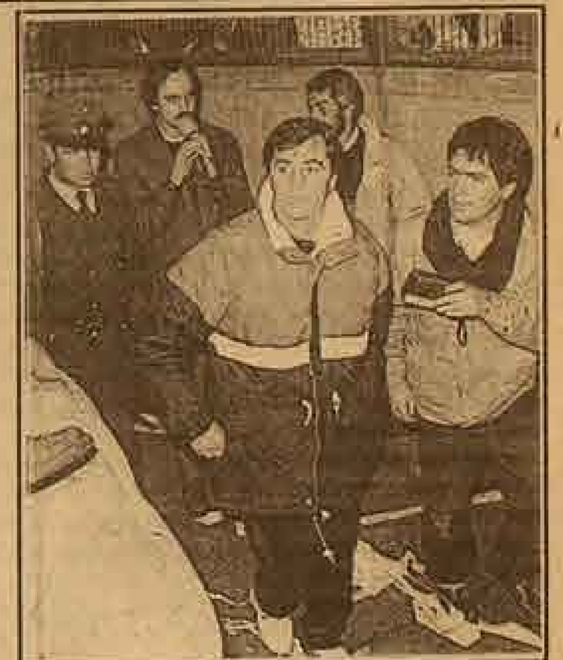
Mirko Jozic criticó los arbitrajes en esta etapa de la Copa Libertadores. Anoche terminó feliz.