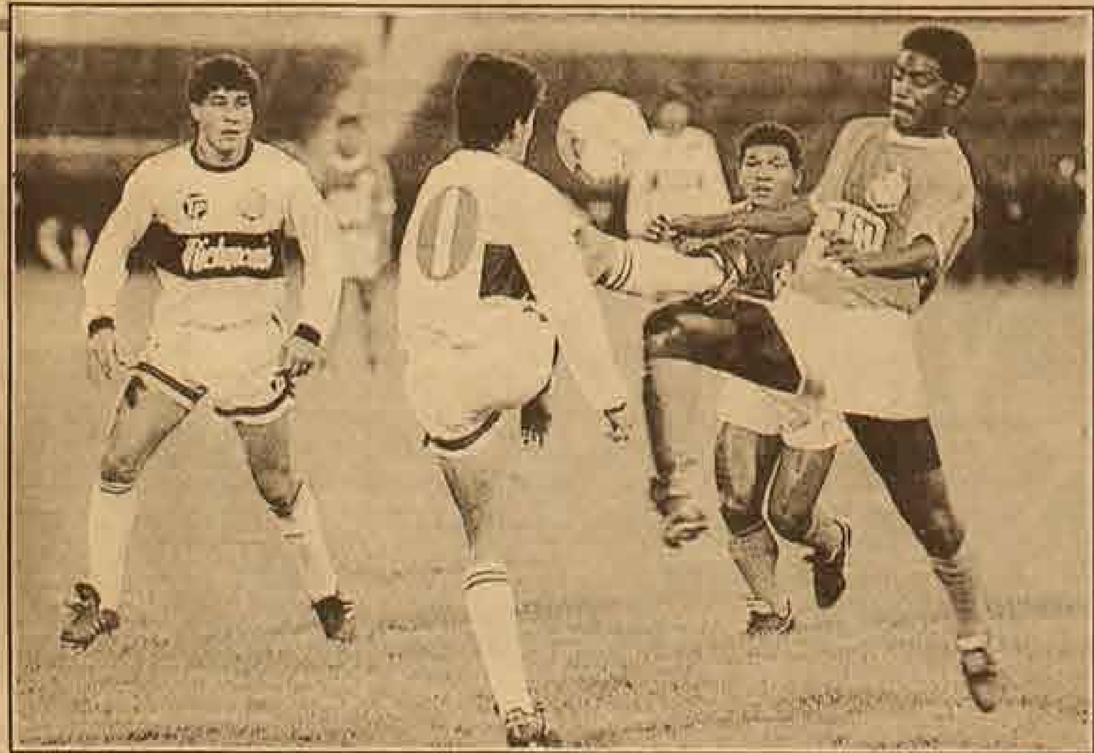
Olimpia y Nacional de Medellín protagonizarán esta noche la segunda semifinal de la Copa Libertadores. Será el choque de dos estilos de juego.

Sobre el bochornoso incidente que protagonizaron los jugadores de Boca Juniors, manifestó que "debo felicitar especialmente a Carabineros, que tuvo un gran desempeño. Sinceramente lamentable lo de los argentinos, porque pareciera que no saben perder. Este tipo de hechos deben desterrarse del fútbol. Pese a todo, igual podemos celebrar y creo que la victoria fue justa, Colo Colo fue más que Boca".