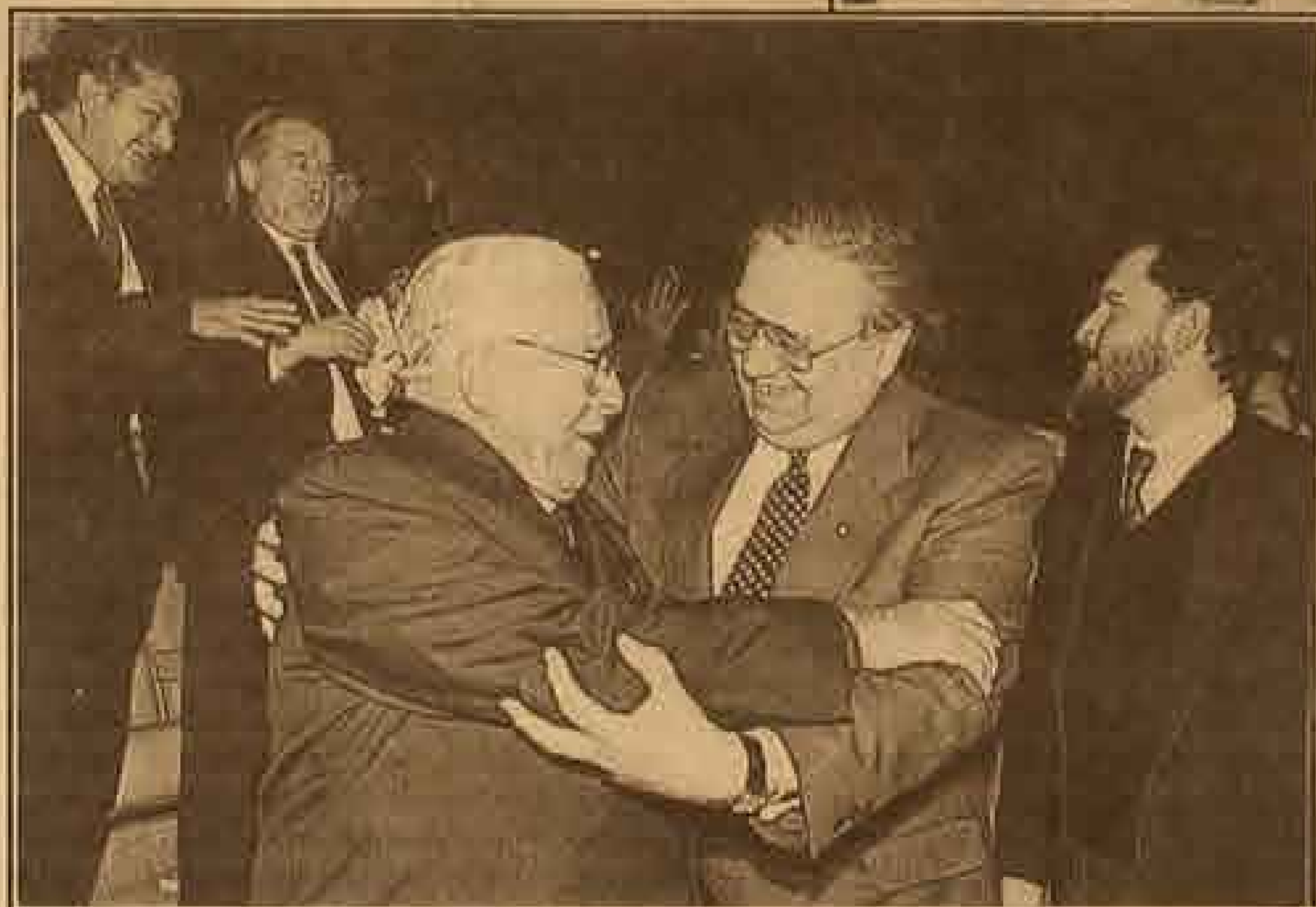
El Ministro del Interior, Enrique Krauss, se abraza con el padre Manuel Acuña, dirigente de Colo Colo.

Con el doble de la dotación normal, Carabineros ejerció un estricto control de seguridad en las inmediaciones del estadio. Al menos unos 500 carabineros custodiaron el recinto.