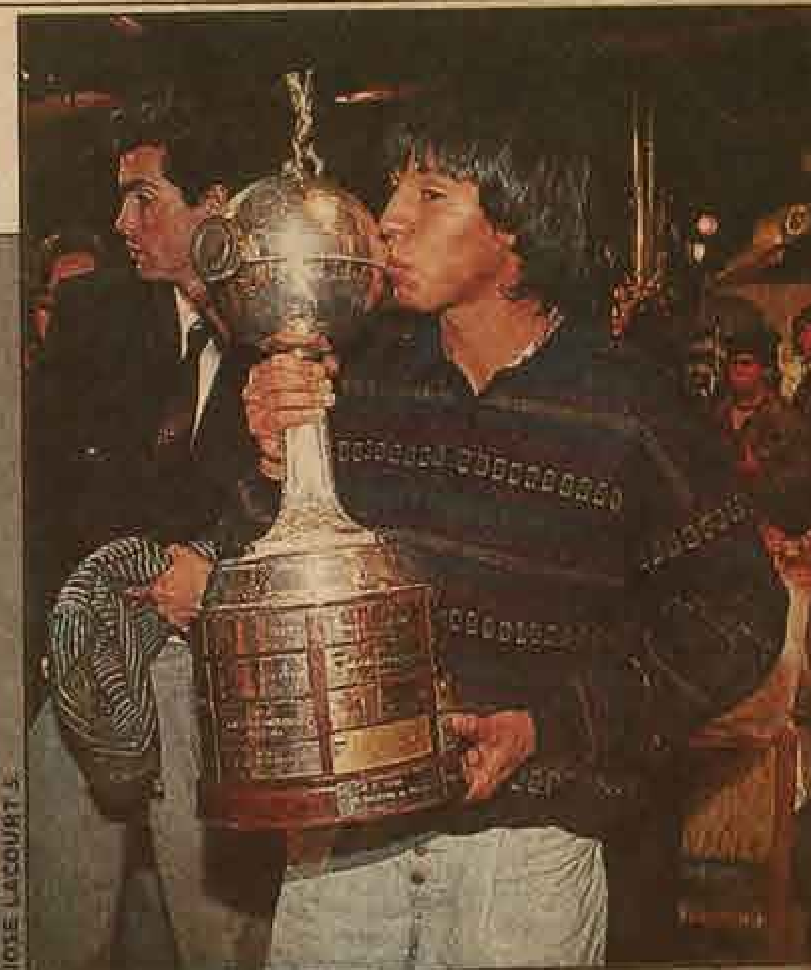
CON LA COPA que contribuyó a ganar para Colo Colo.

las decisiones del segundo en la dinastía, reconoce que, de vez en cuando, un buen consejo es la mejor ayuda que le puede dar a su retoño.