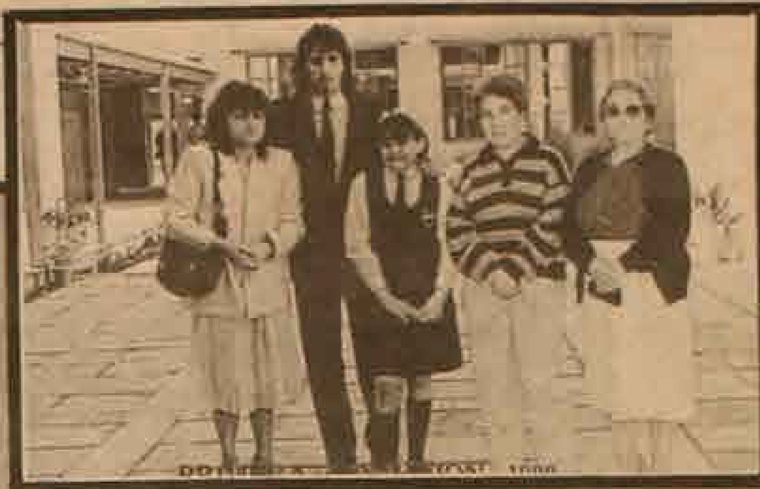
CON SU HIJO... colocolino, en familia y anoche, posando tras el triunfo.