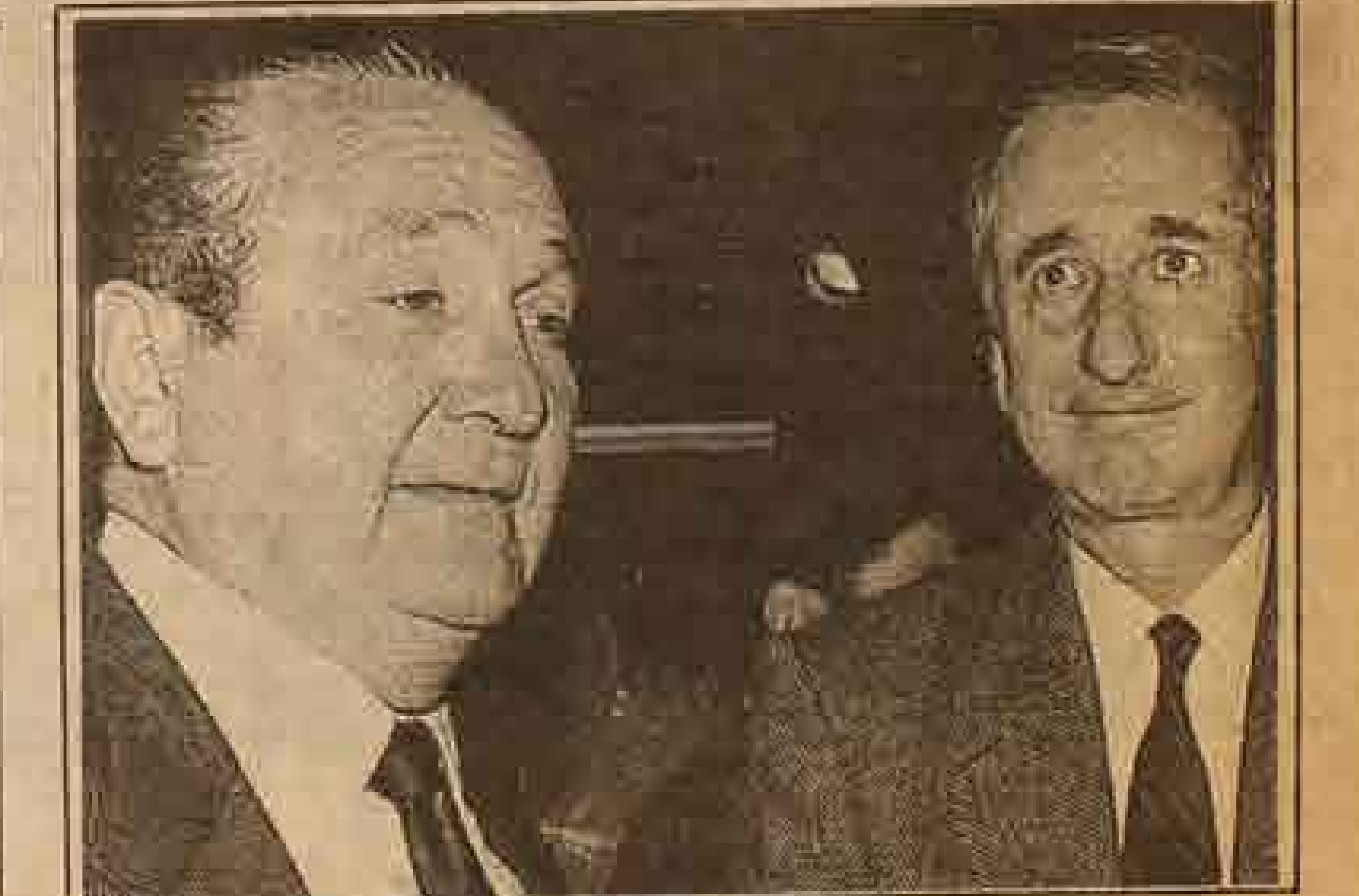
Nicolás Leoz, presidente de la Confederación Sudamericana de Fútbol, y Jaime Tohá, Ministro de Energía.