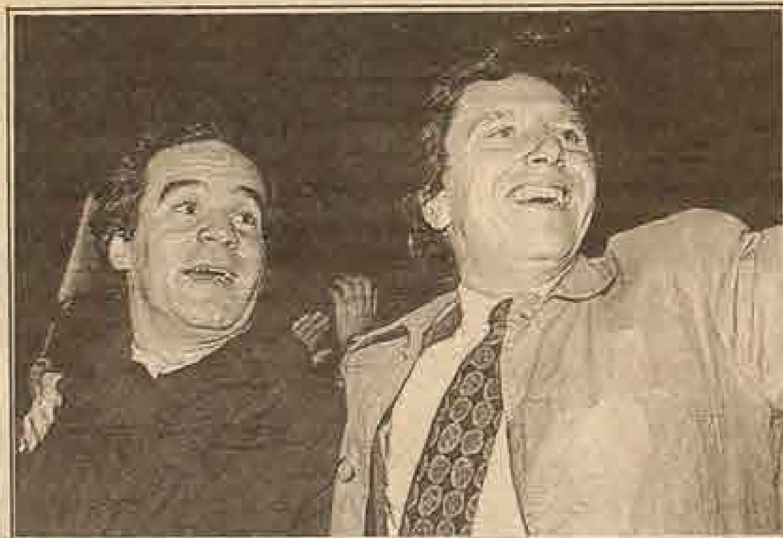
El presidente de Renovación Nacional, Andrés Allamand, y el diputado Alberto Espina.