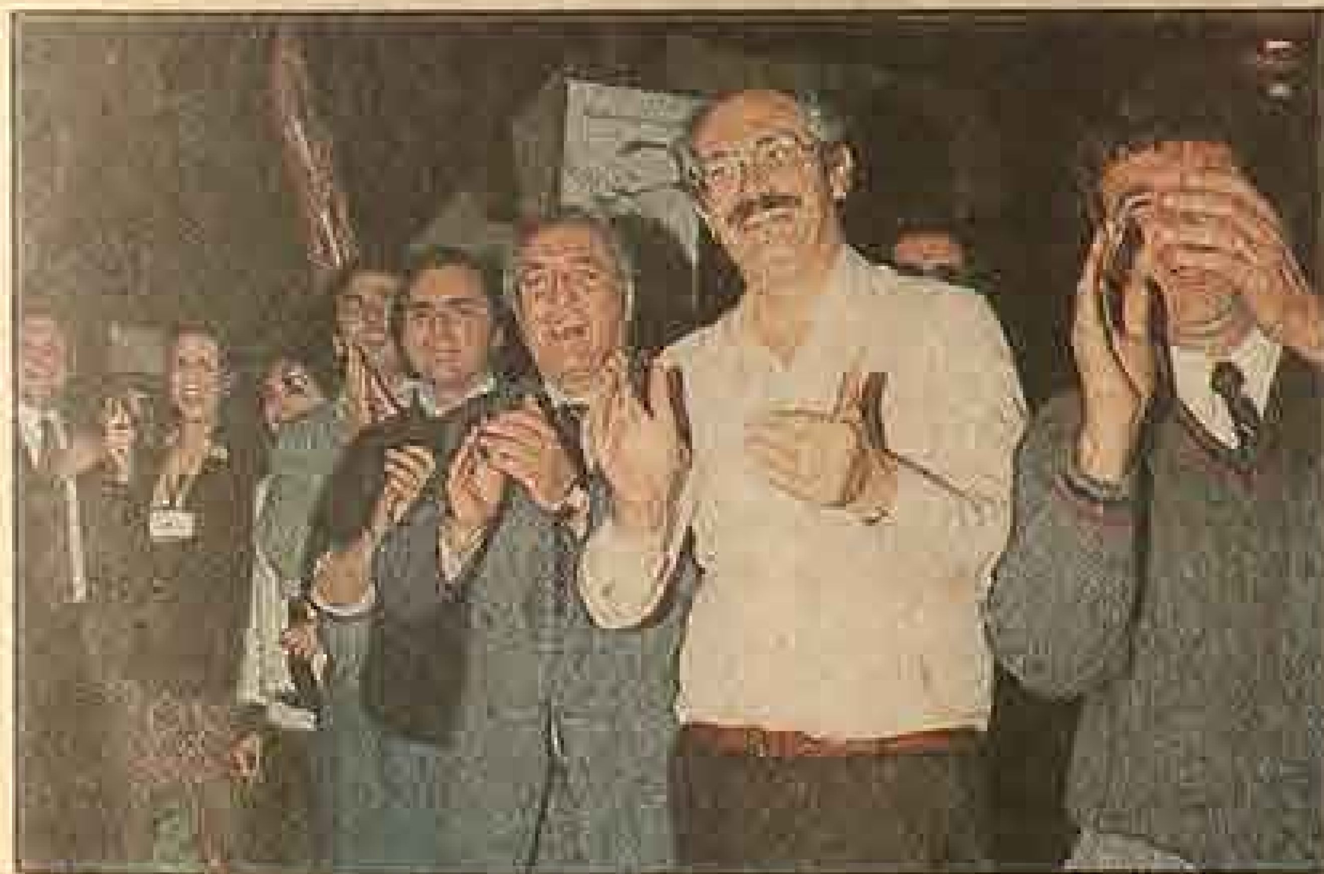
El entusiasmo de los hinchas en el restaurante "Don Carlos" no decayó ni un instante.