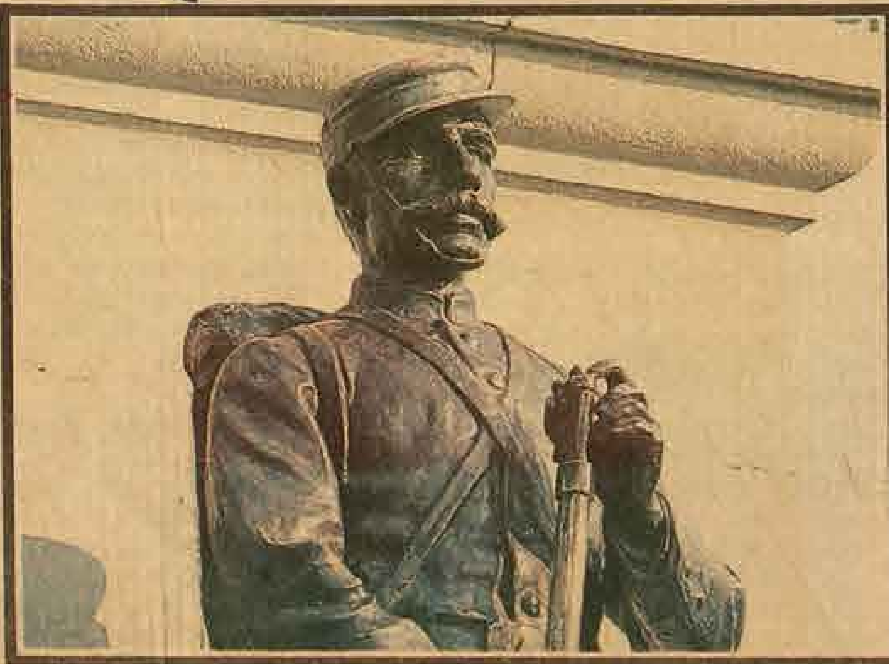
Le robaron la bayoneta al "Soldado desconocido"