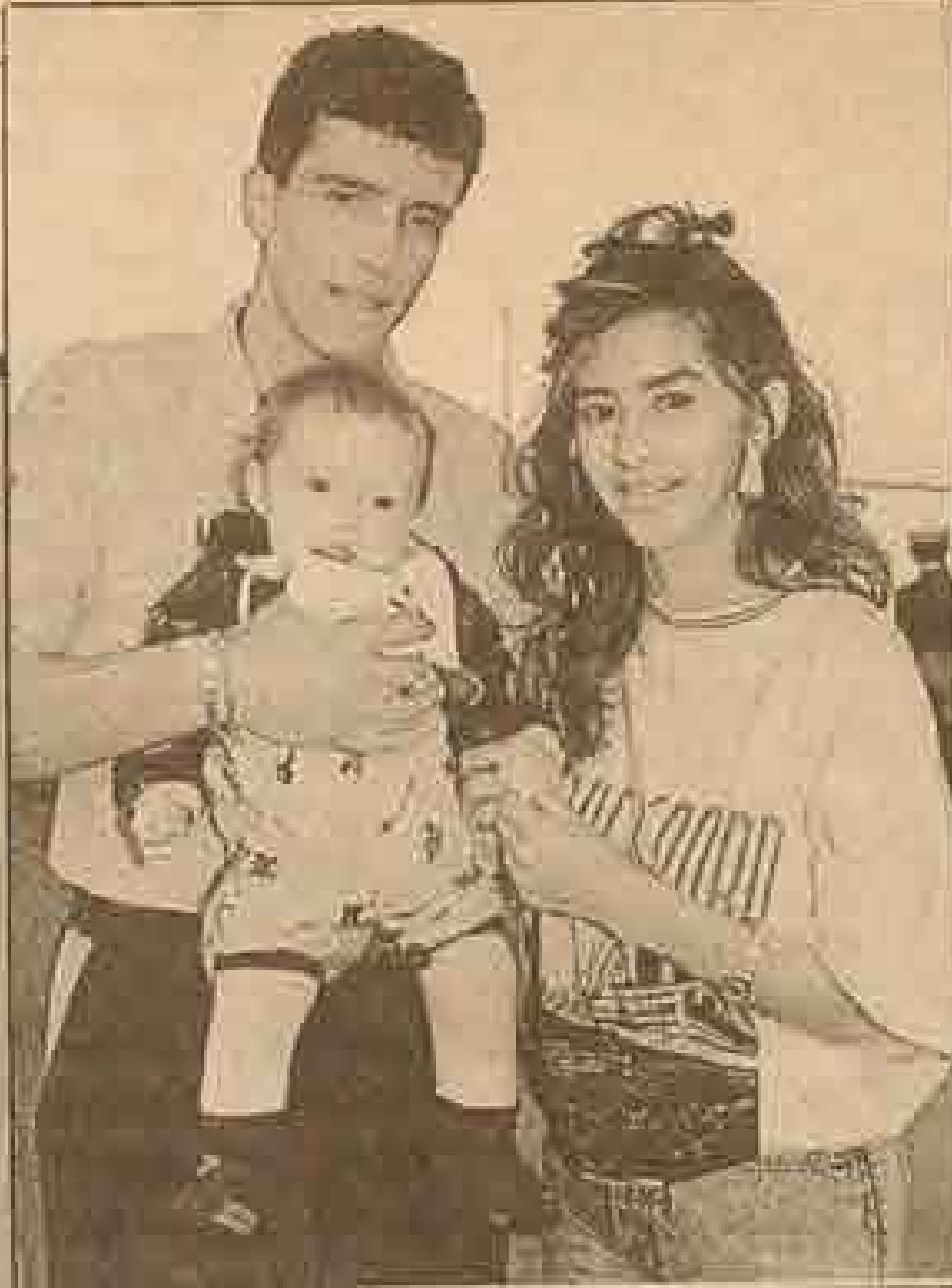
LA FABRICA MARGAS, con su esposa y socia y durante la emoción de la victoria.