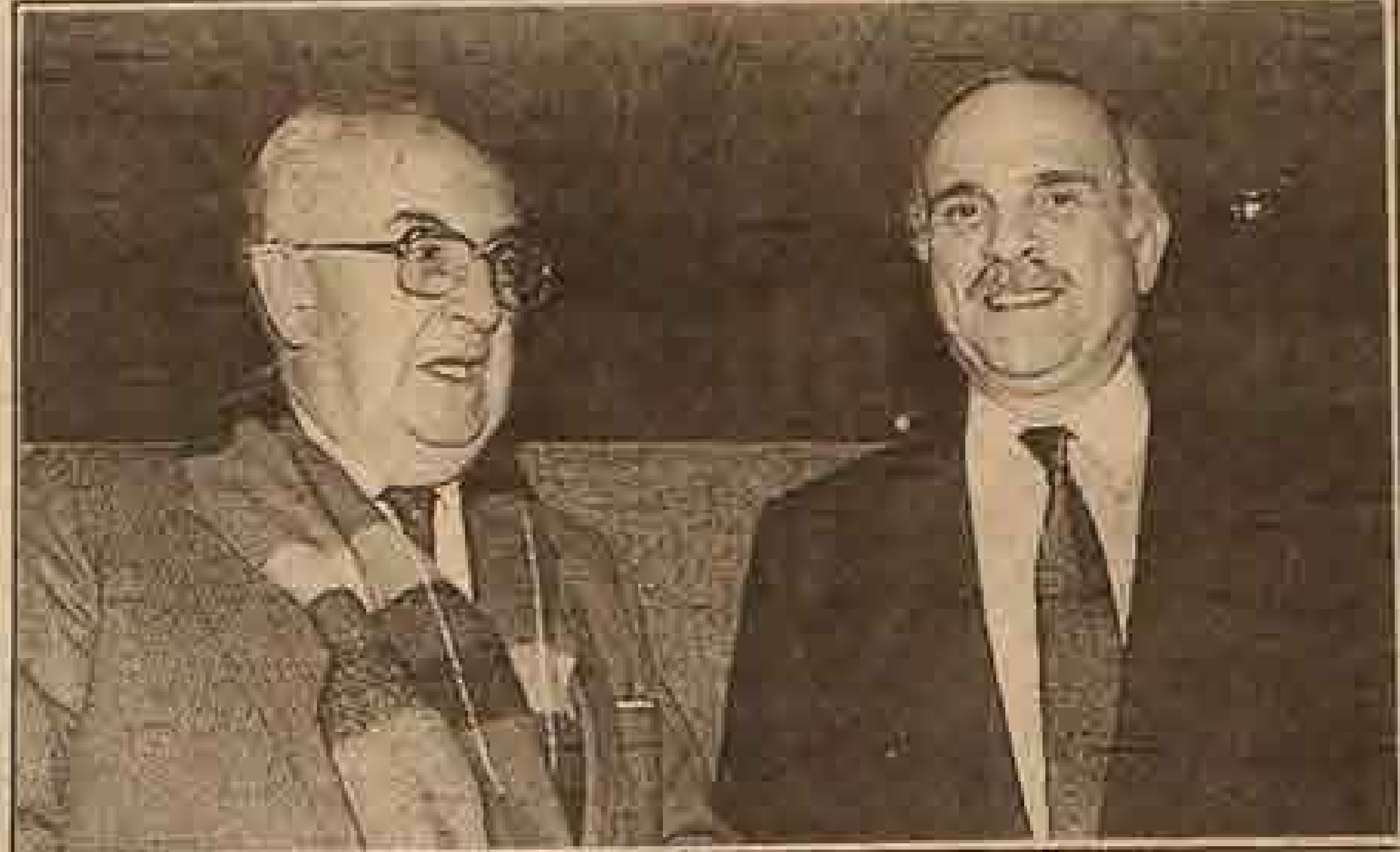
El Ministro de la Corte Suprema, Hernán Cereceda y el Ministro de Bienes Nacionales, Luis Alvarado.