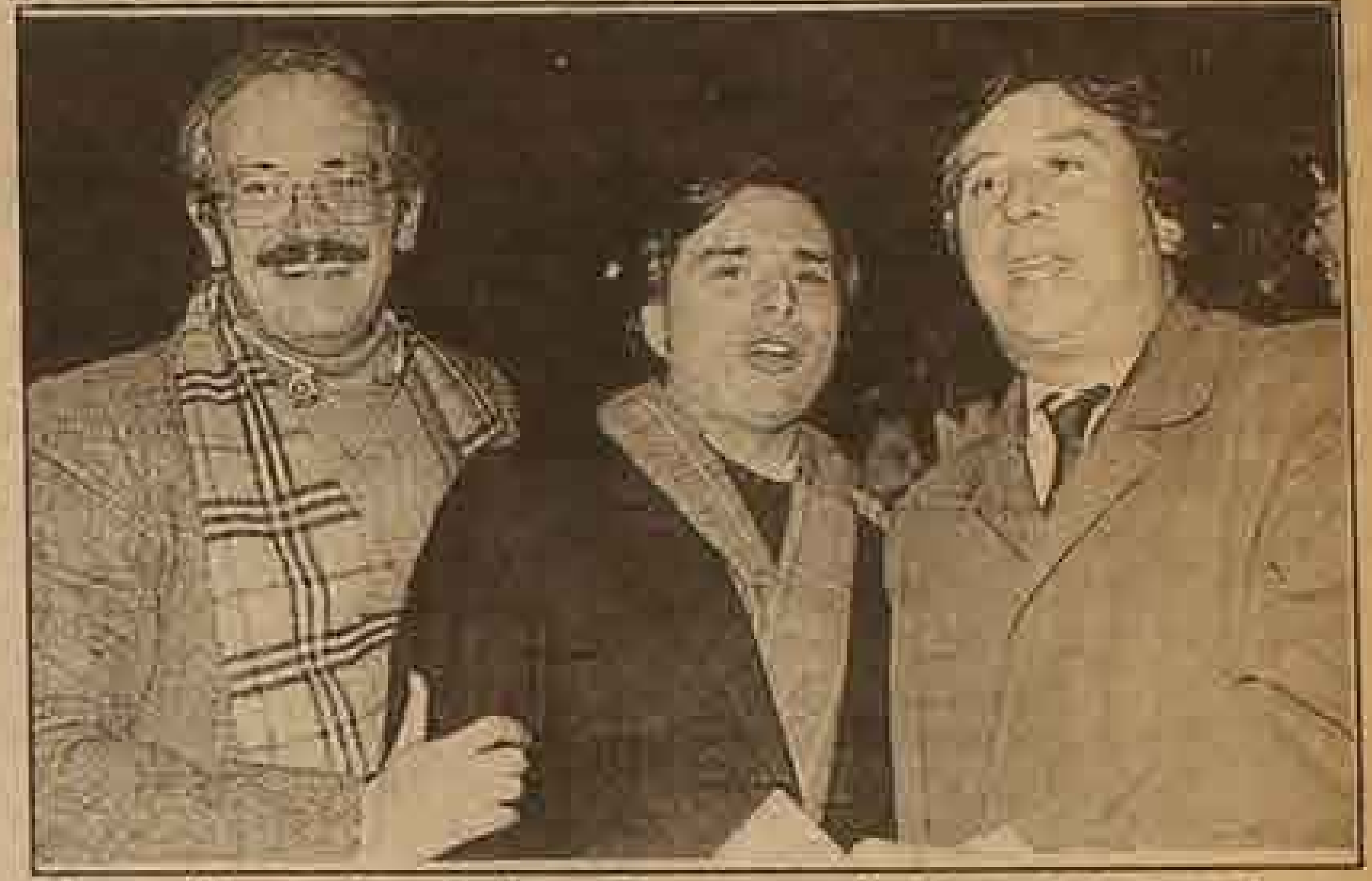
Los diputados Jaime Estévez, Andrés Chadwick y Víctor Manuel Rebolledo.