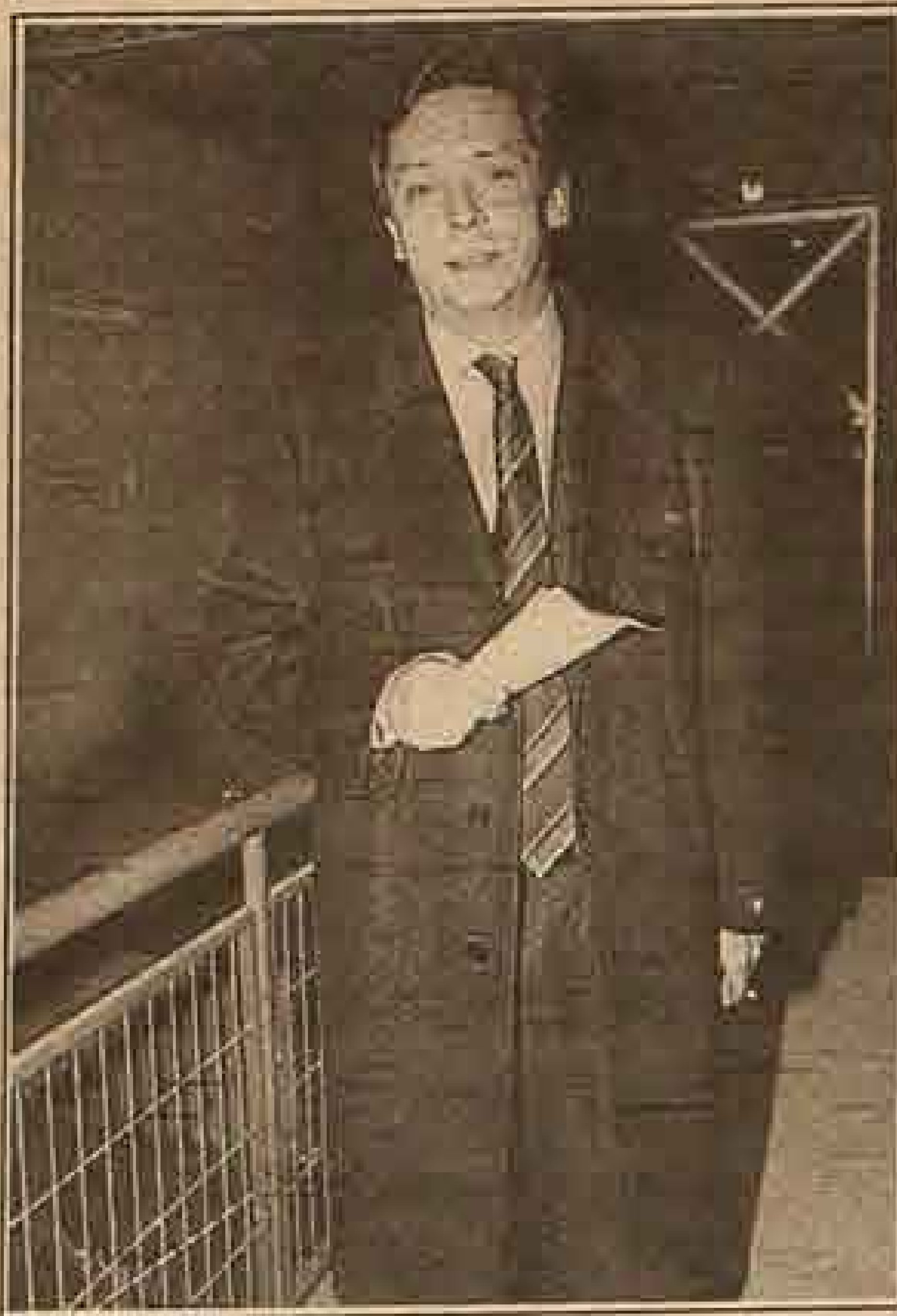
El Ministro de Economía, Carlos Ominami ingresa al estadio.