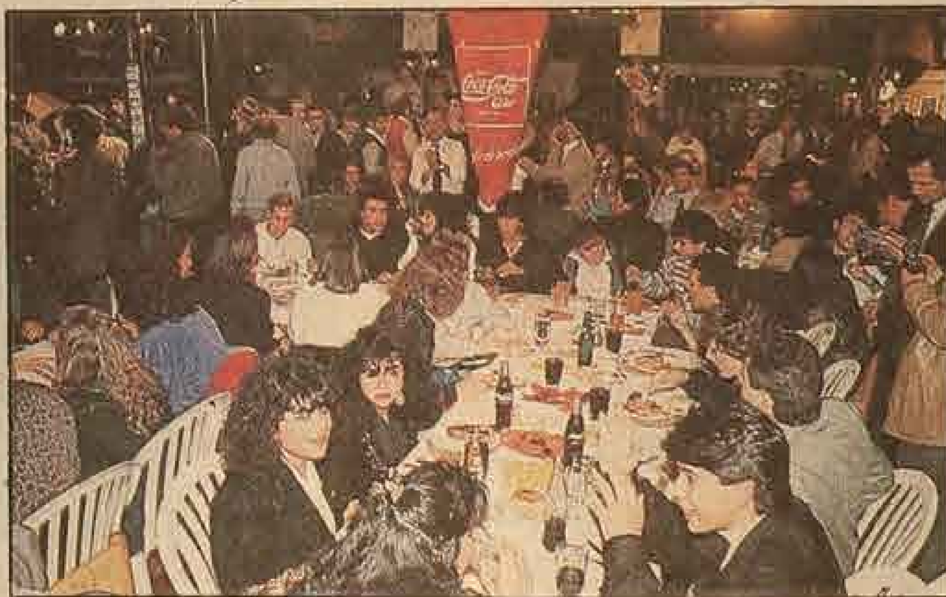
En la comida de celebración, en el restaurante "Don Carlos".