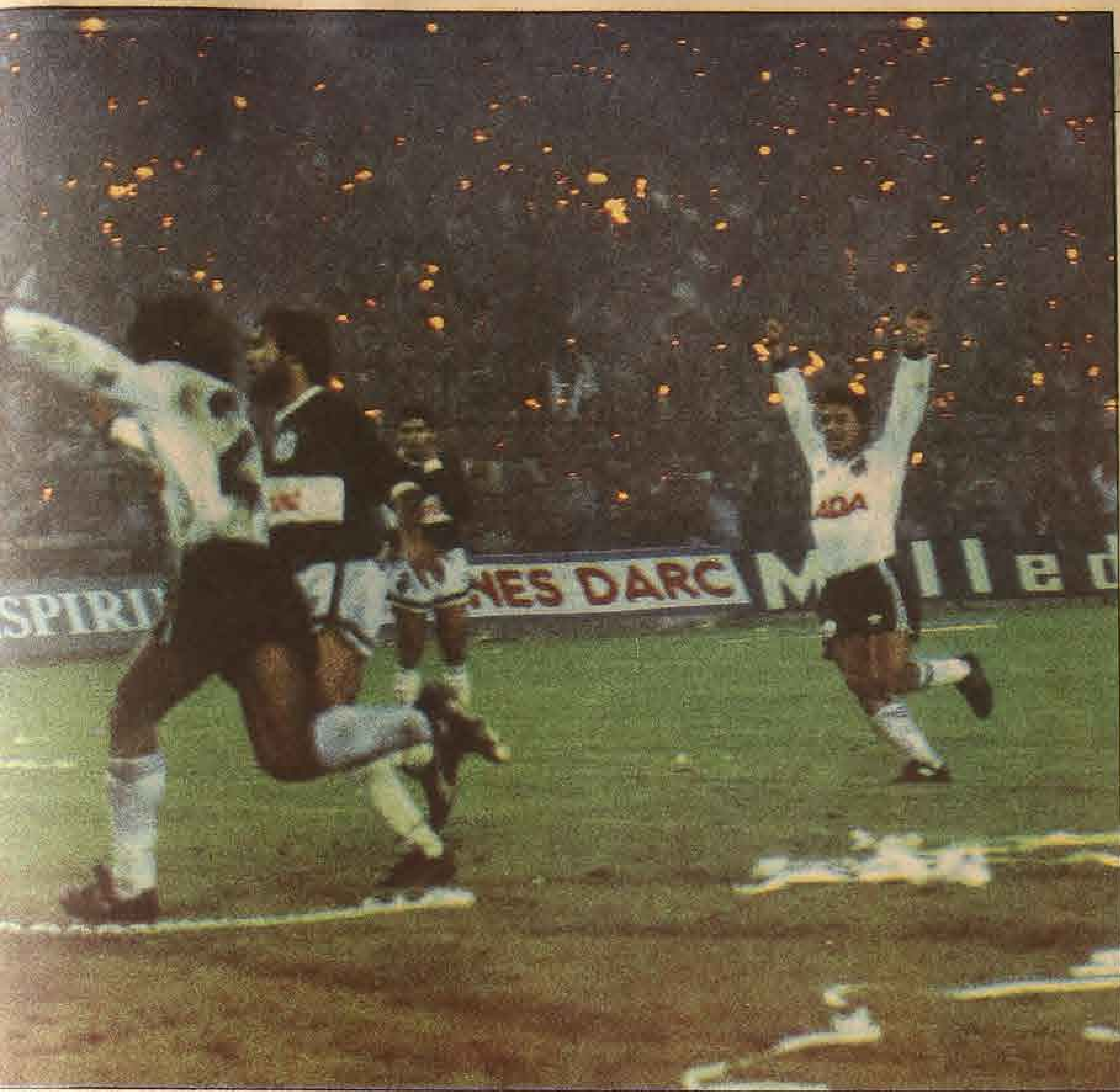
...le dio la tranquilidad y sacó el grito de las gargantas albas: "¡Campeones, la Copa se mira y se toca...". El cuadro de Jozic ganó el 8 de diciembre próximo, por la final de la Copa Intercontinental de Clubes.