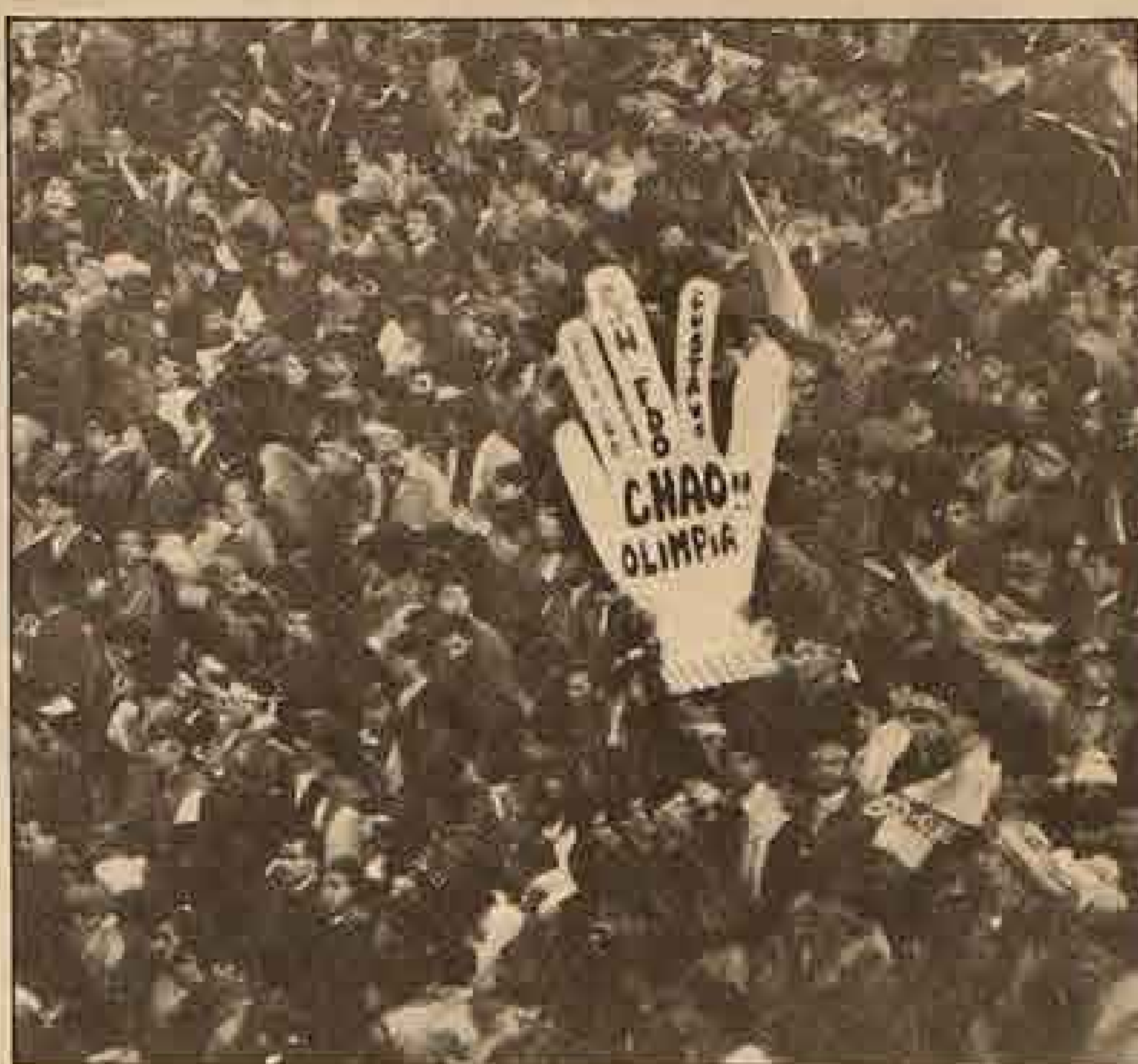
Todo Chile estuvo presente en el Monumental, con el ingenio para celebrar desde antes del 3-0: San Fernando puso su cuota de humor...

"Esto es el esfuerzo de cinco años, de un trabajo tenaz tanto de dirigentes como de jugadores y técnicos para poder lograr algo tan anhelado para el fútbol chileno. La verdad que me siento muy orgulloso de mi club y siento una alegría grande que quiero transmitir a todo Chile, incluso a la gente de las bases antárticas que orgullosos nos mandaron sus saludos. Este directorio seguirá haciendo grande al club para felicidad de nuestros millones de hinchas".