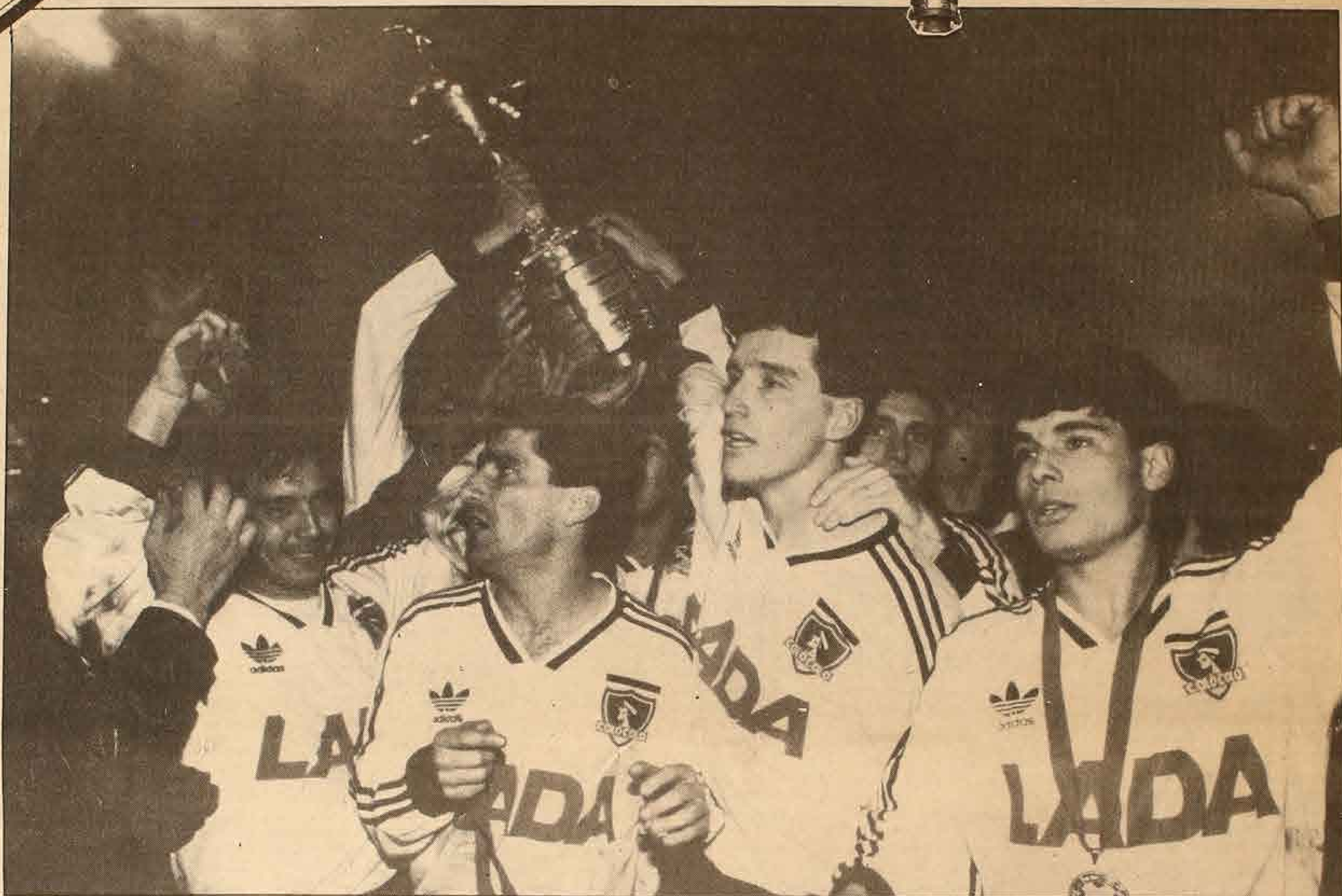
El momento esperado durante tres décadas: jugadores de un club chileno, Colo Colo, recibiendo, por fin, el trofeo más codiciado: la Copa Libertadores de América.