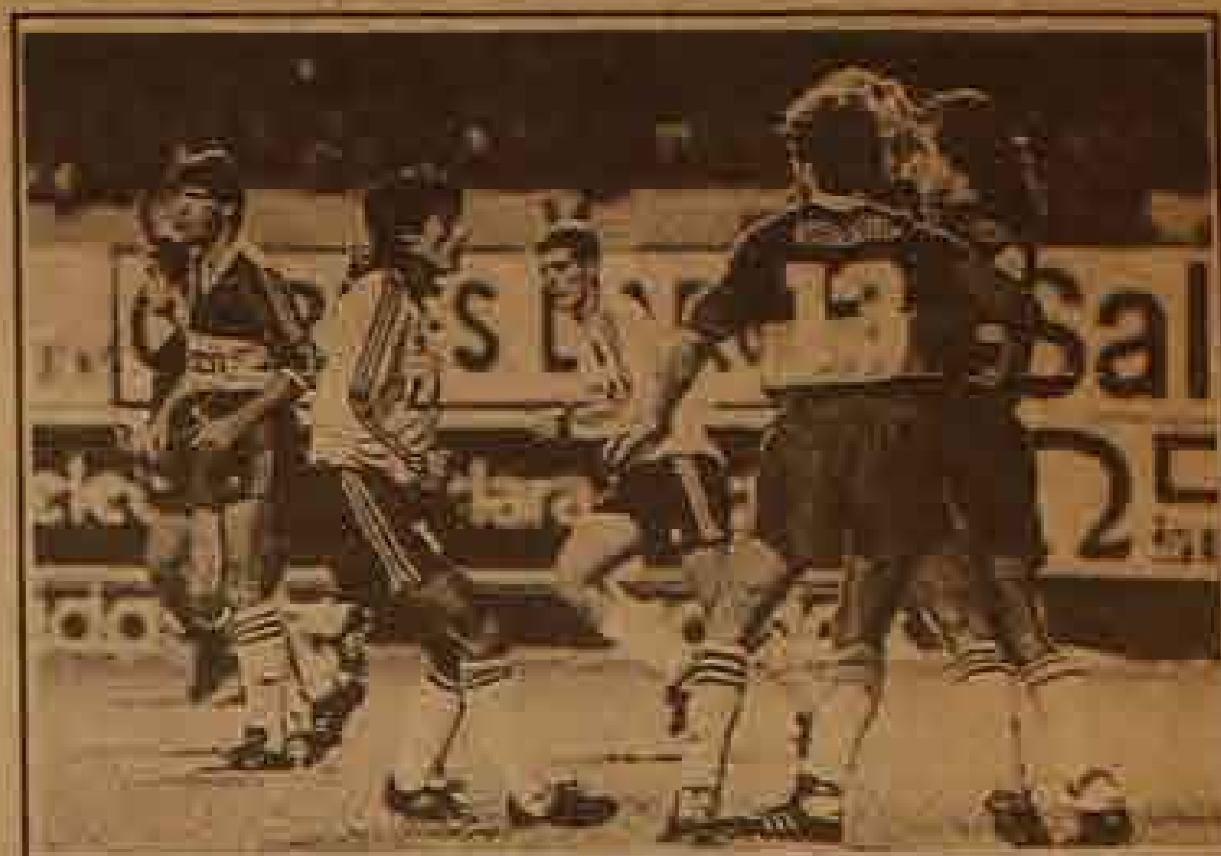
Boca resultó un producto de la cacareada publicidad rioplatense para el Cacique, y quedó fuera de combate. El Colo se paró bien en La Bombonera y estuvo a un cachito de traerse un puntete, pero acató barrió con los ches.

BOCA JUNIORS 1: Navarro Montoya; Abramovich, Simón, Marchesini y Hrabina; Stafuza, Soñora, Pico y Latorre para Boca.