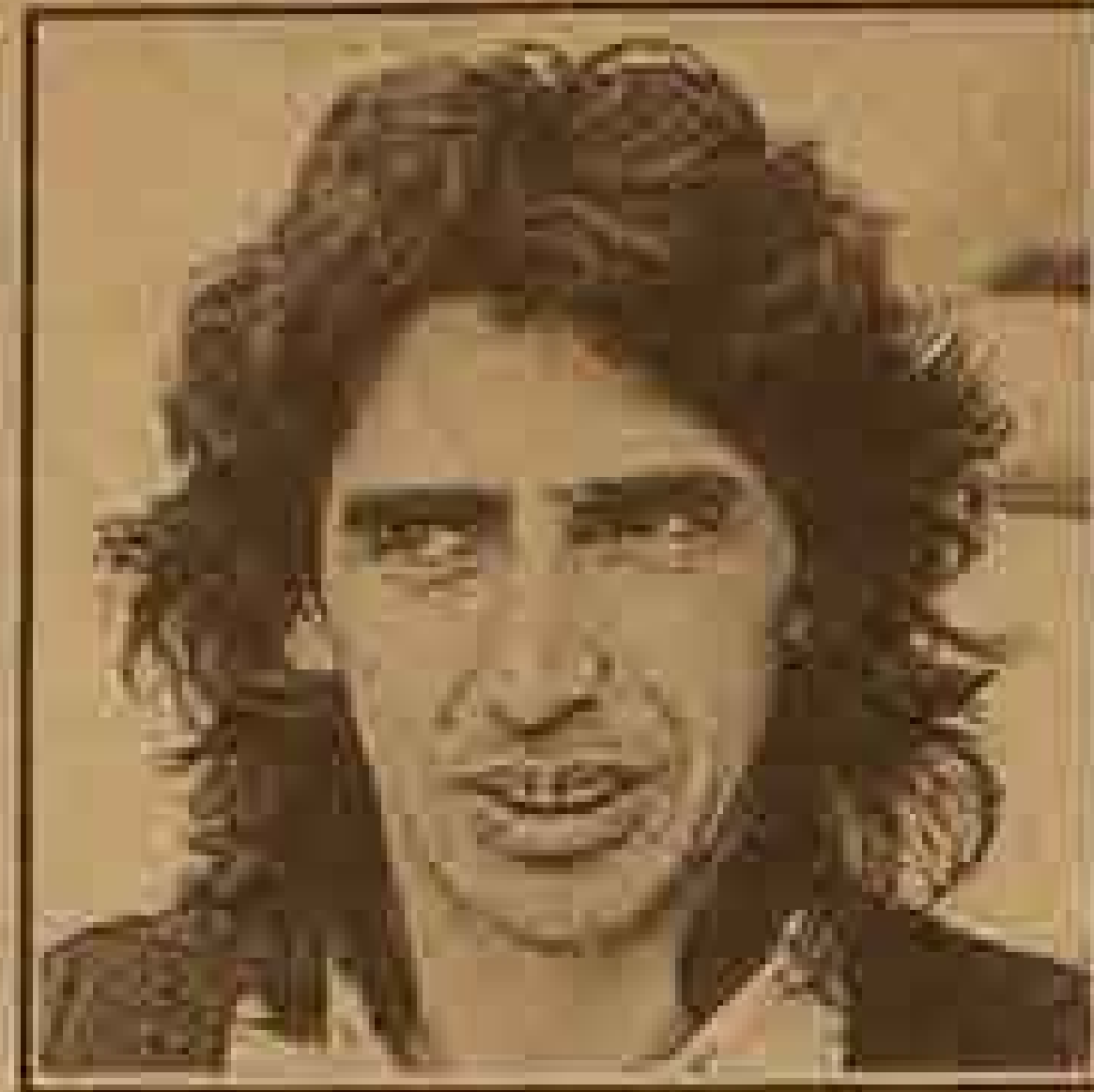
Nombre: Lizardo Garrido. Apodo: "Chano" y "Flaco". Puesto: Defensa (libero). Edad: 33 años (25-08-1957). Peso: 73 kilos. Estatura: 1.84 m. Estado civil: Casado. Nacionalidad: Chileno. Clubes: Colo Colo, Colchagua, Trasadino y el Cacique.