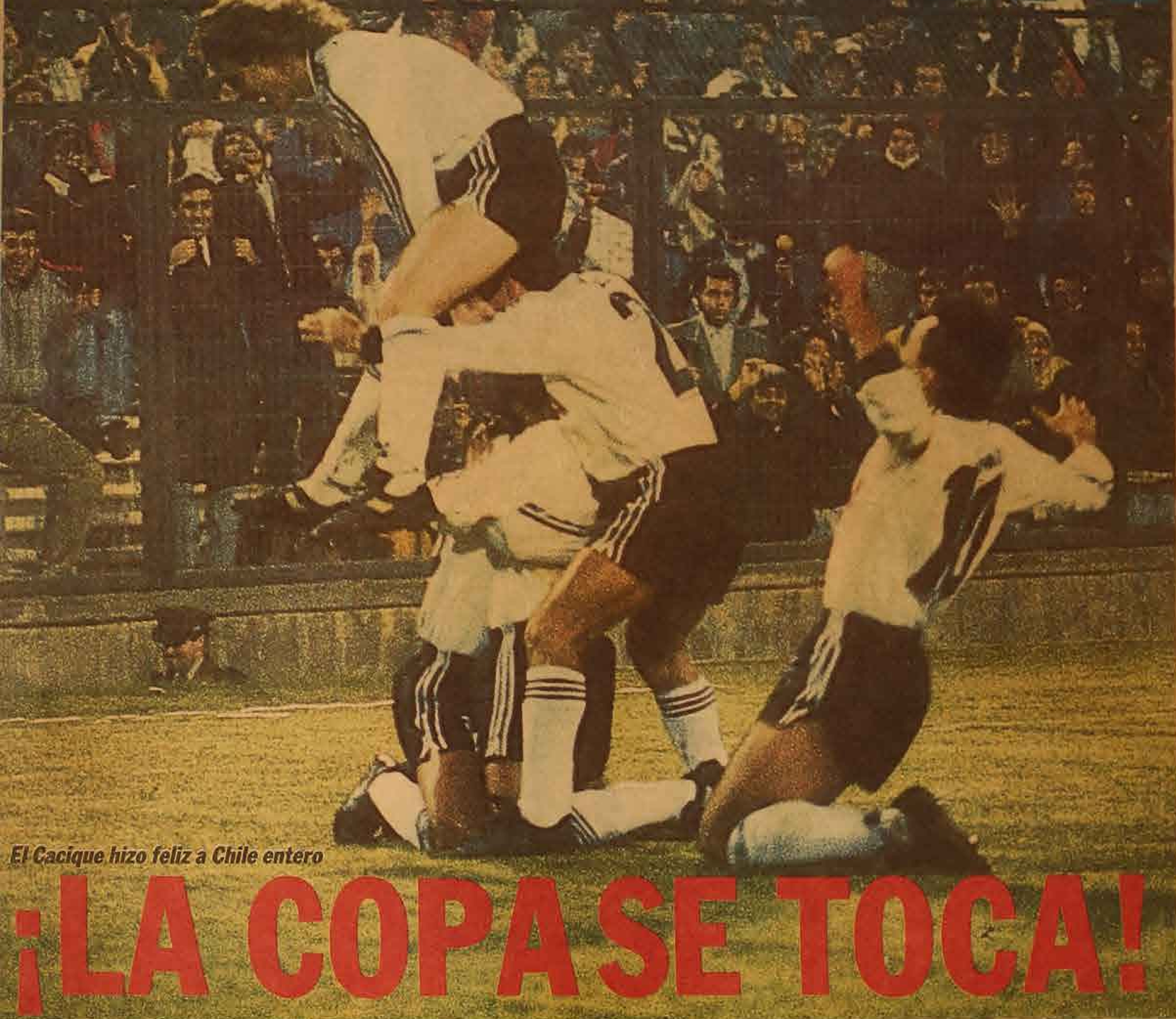
El Cacique hizo feliz a Chile entero