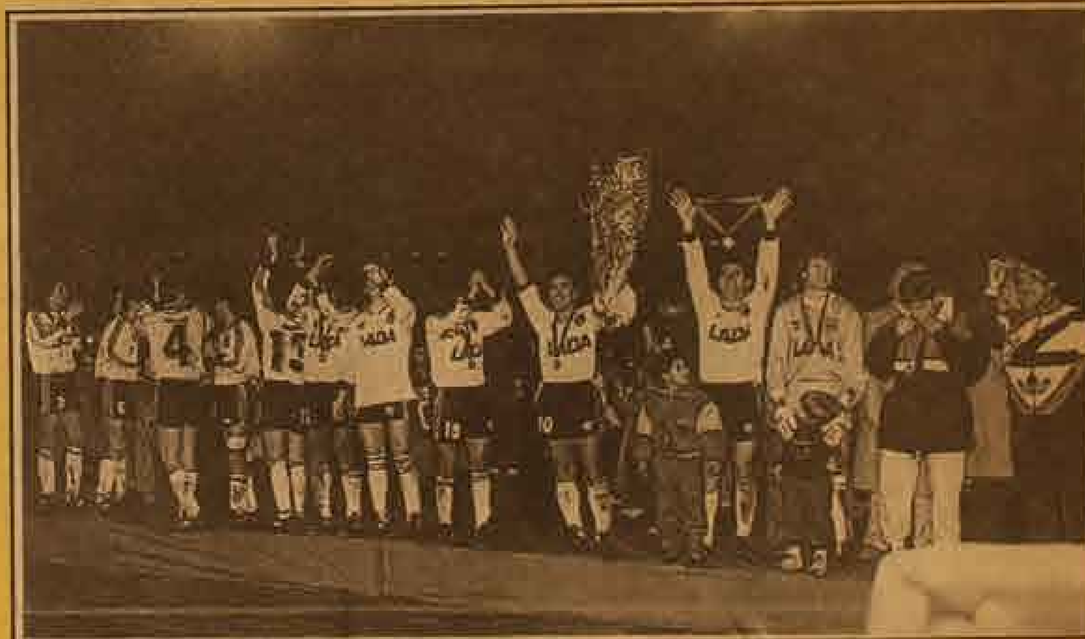
La muchachada alba, más contenta que can con insectos, recibe la ovación de la gallada que repletó el Monumental. Los cabros jugaron la biblia y demostraron ser los mejores.