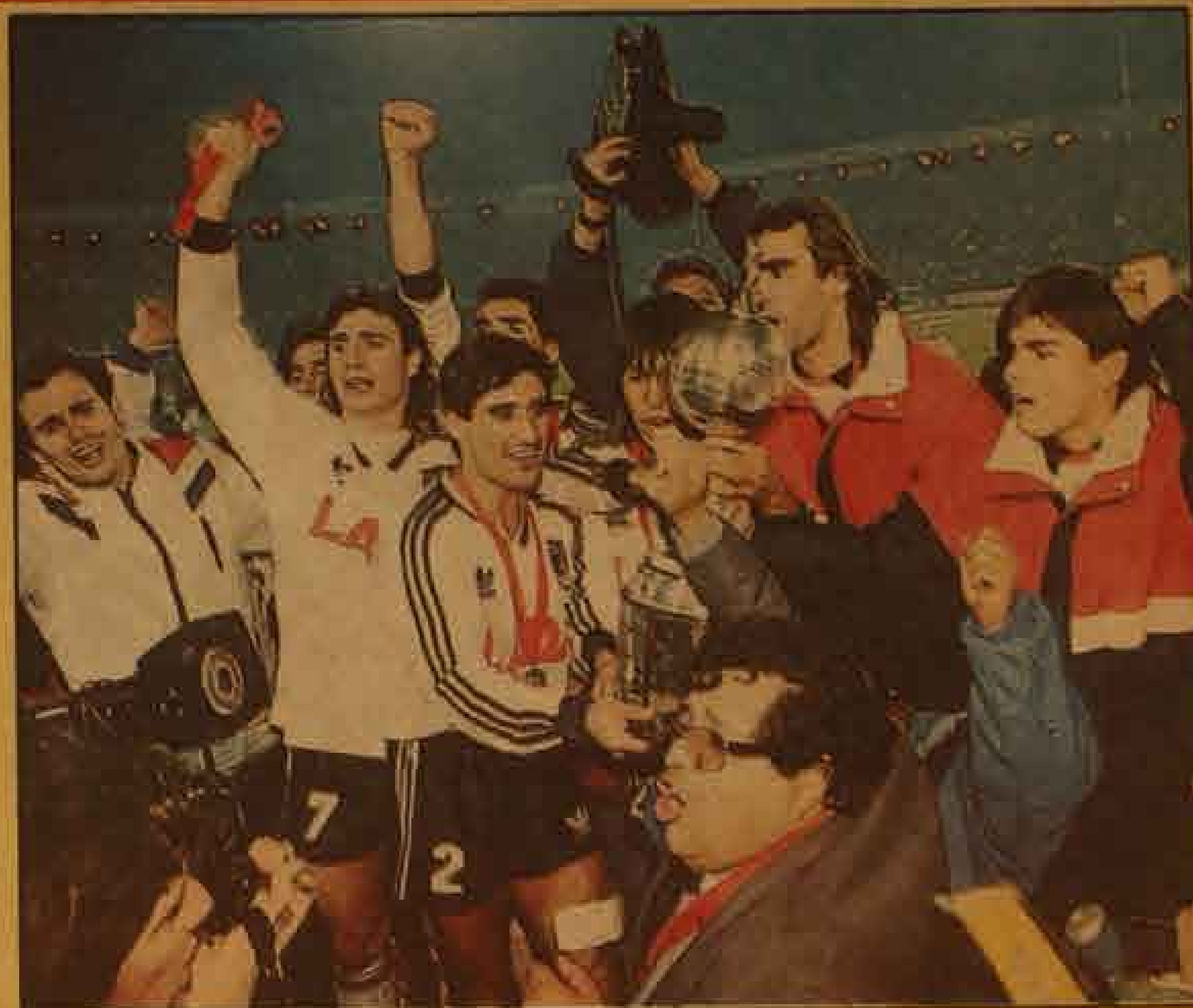
Los jugadores del campeón de América con el trofeo que durante años persiguió el fútbol chileno. Ahora la Copa está en casa y la disfruta todo el pueblo chileno.

La noche que Colo Colo hizo feliz a todo un pueblo