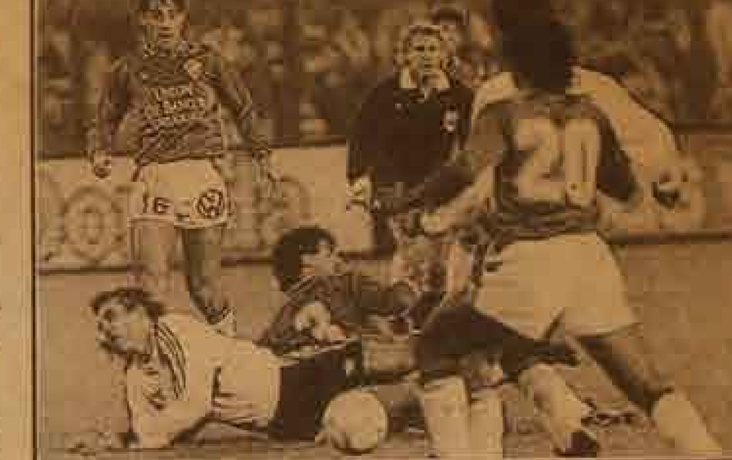
La histórica boleta a los charrúas de Nacional todavía duele en el país oriental. Fue una gran noche para el fútbol chileno, brindada por Colo Colo.

COLO COLO 0: Morón; Garrido; Ramírez, Peralta y Margas; Mendoza, Vilches, Espinoza y Pizarro; Barticiotto y Martínez.