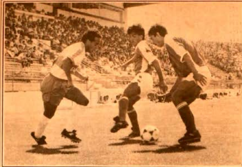
Barrera fue el principal animador de la ofensiva católica en su clara victoria sobre Cobreadino, 4-1