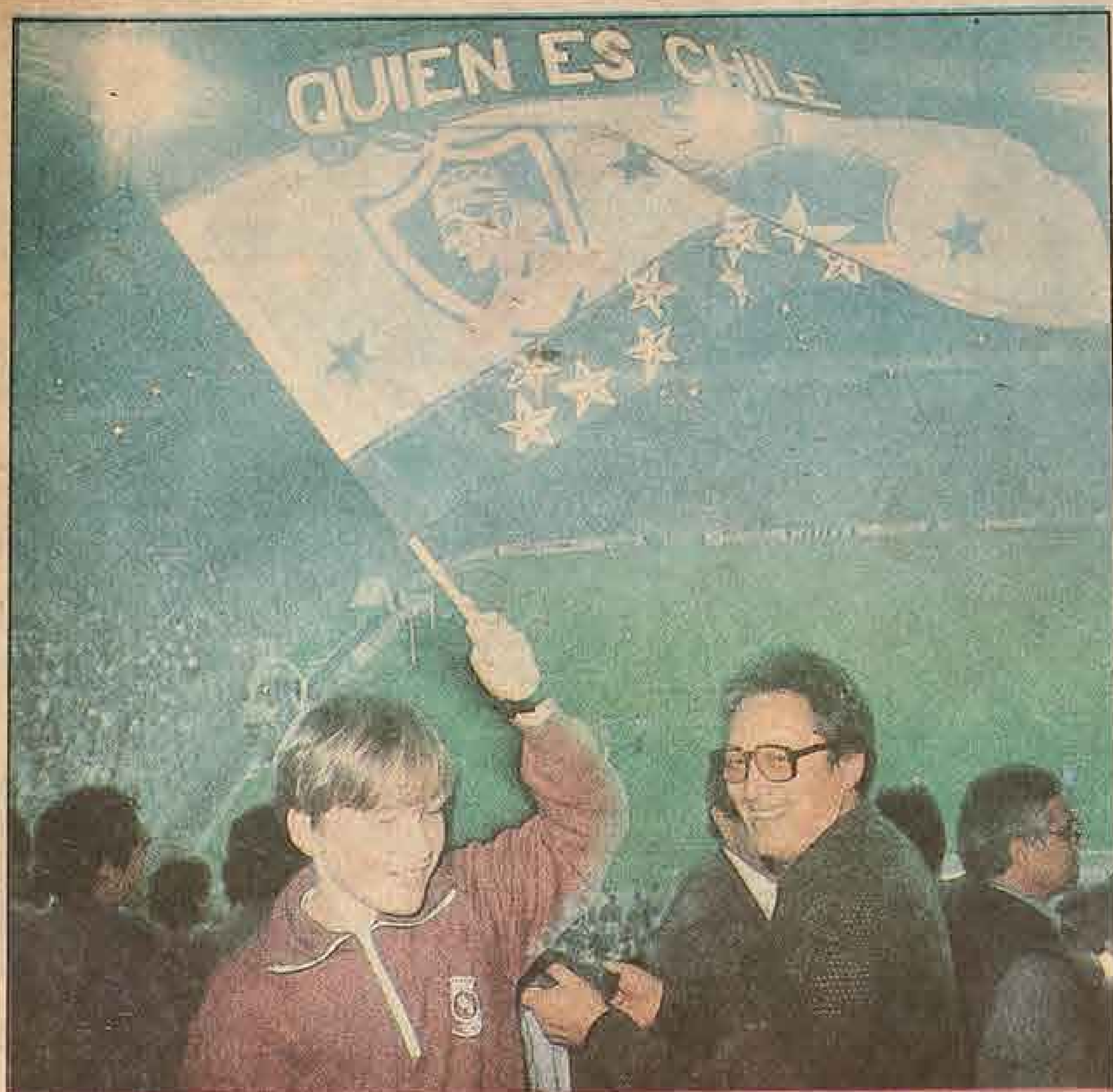
Un pequeño hincha que enarbola la bandera de Colo Colo, simboliza el fervor de los aficionados por la clasificación a la final de la Copa.