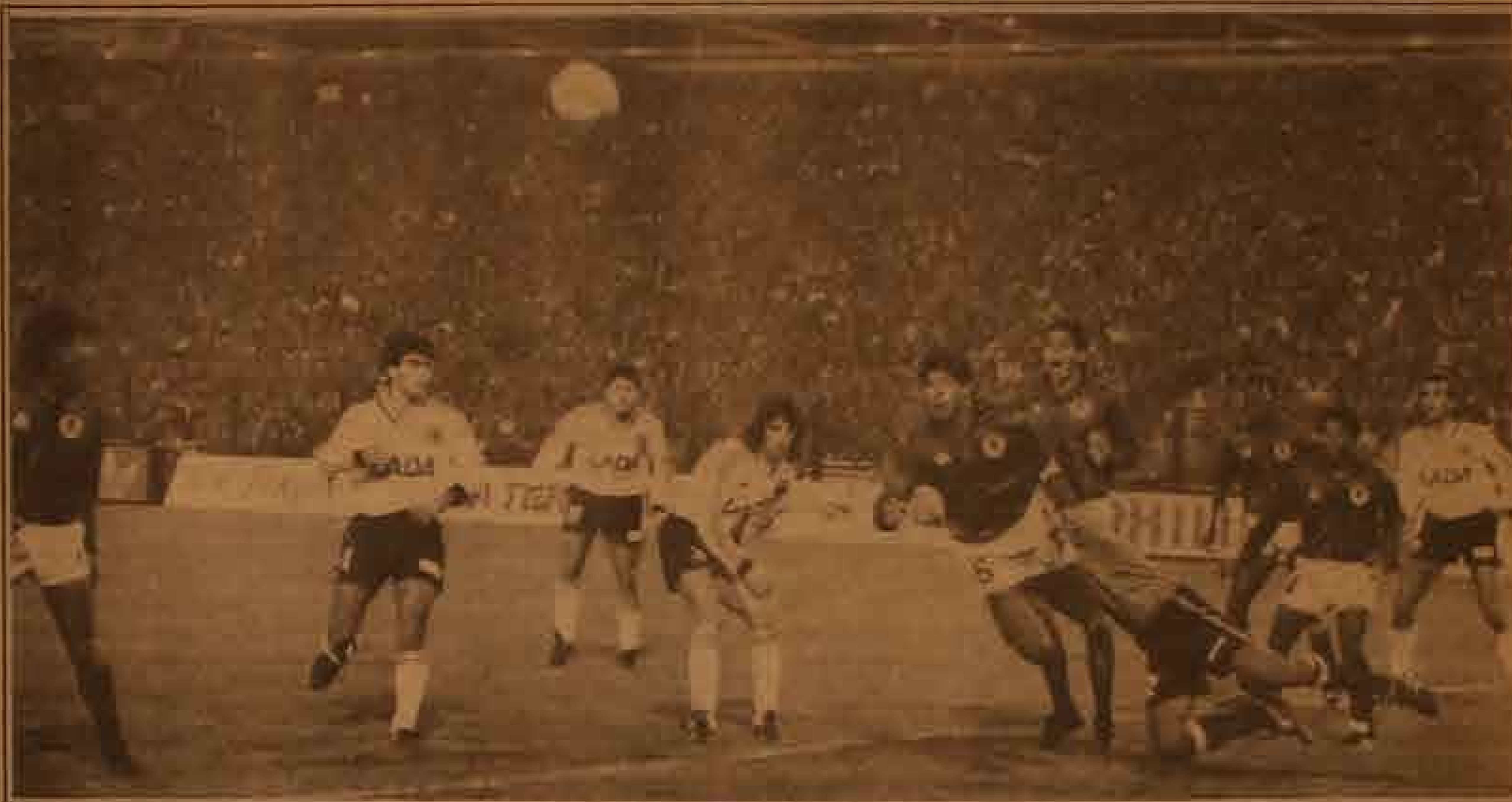
¿Colo Colo sigue buscando el hombre 10?

Y no sólo parará aquí la competencia. Se ha sabido que Megavisión tiene ya muy adelantadas las conversaciones para la transmisión de los partidos de la Copa América. En estas negociaciones, el que pestaña pierde.