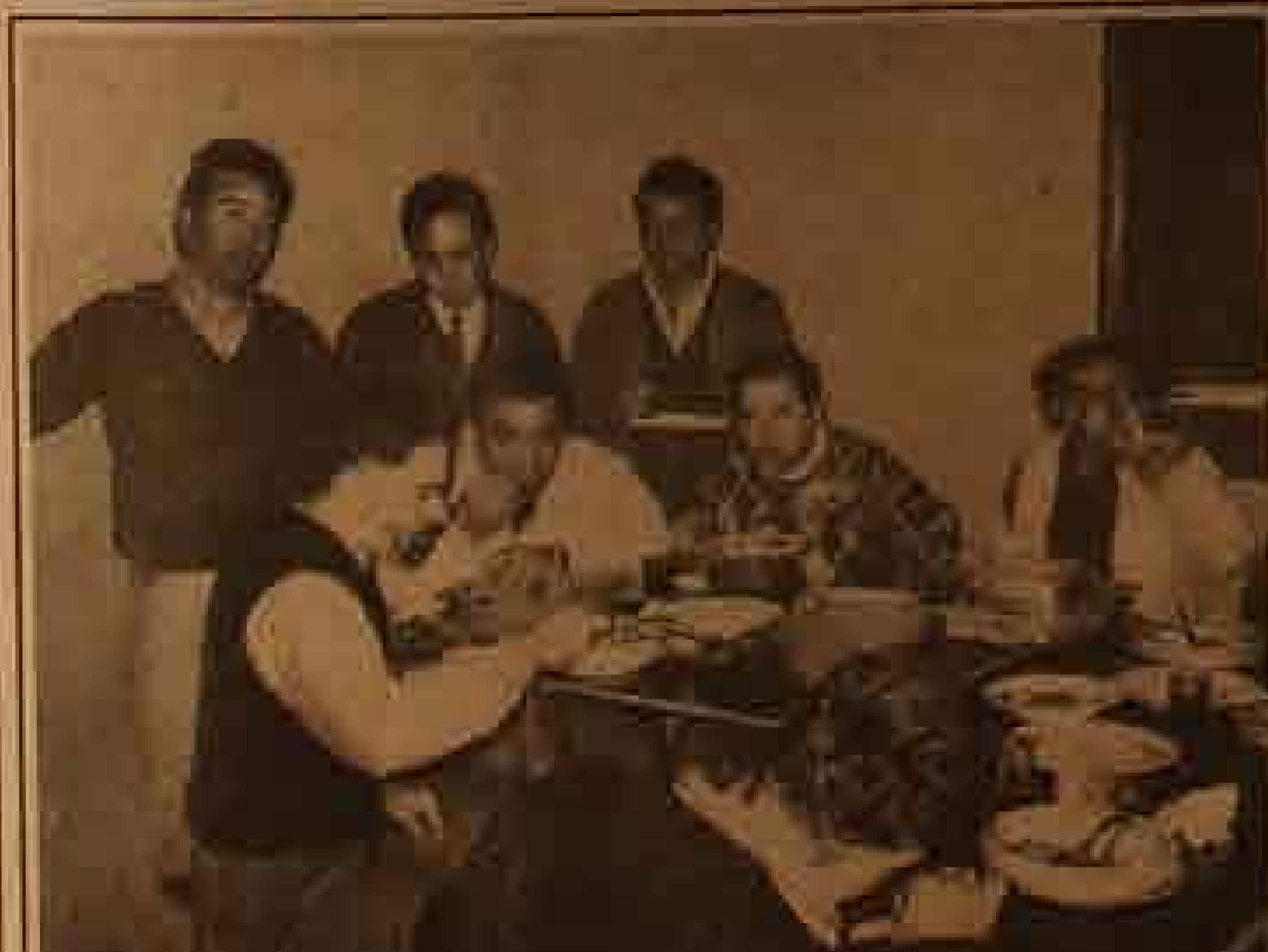
Y ya tranquilos, relajados, el mastique de la amistad