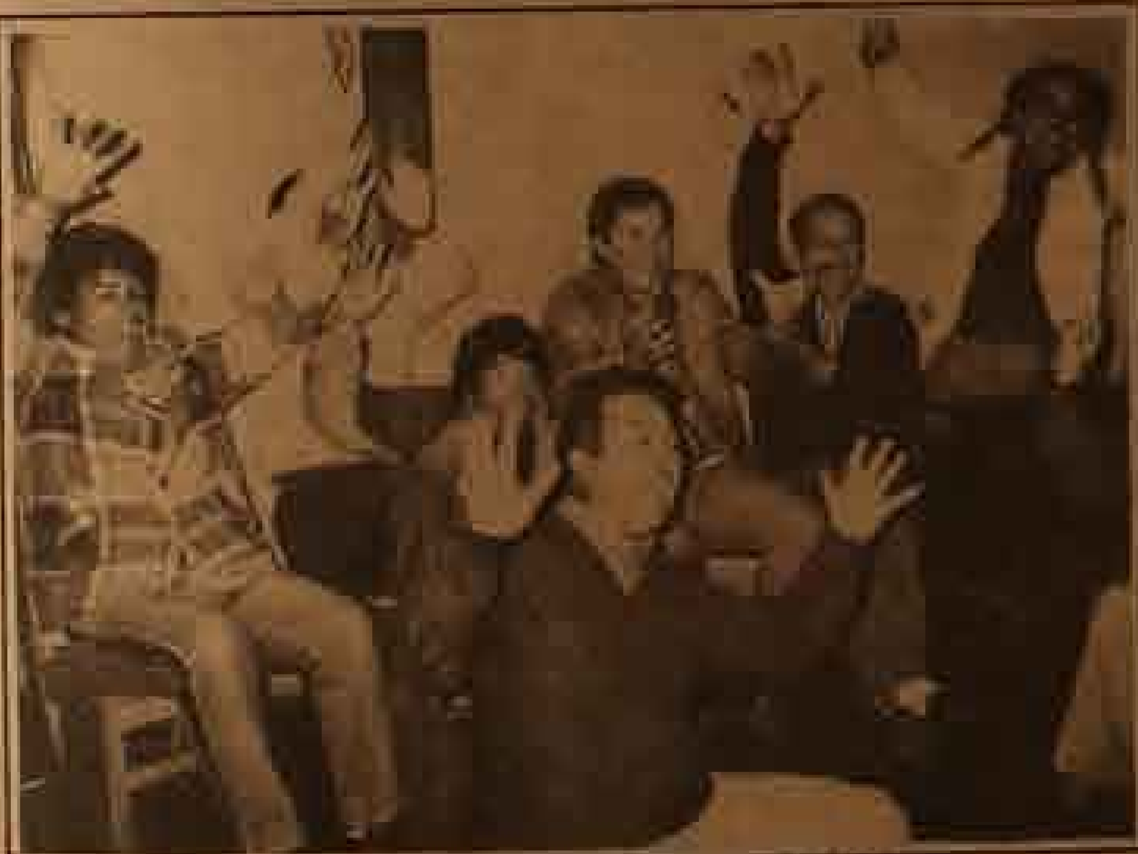
¡Se acabó, menos mal que dejamos de sufrir! Nos clasificamos

La mesa está lista y en un corto tiempo le pegamos al mastique más que las chuletas que repartió el pelao a cuanto colocolinos pasó frente a sus ojos.