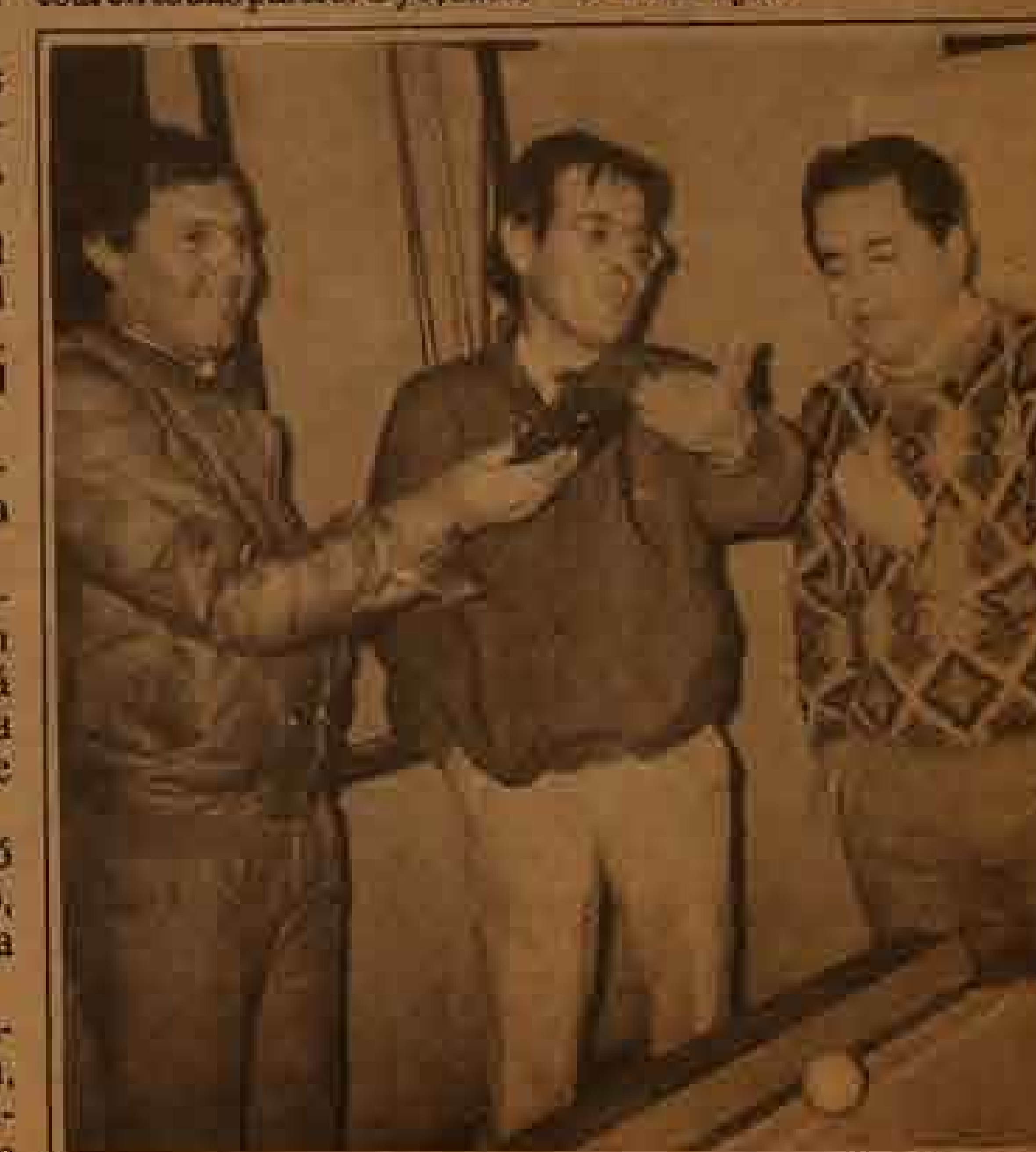
Los comentarios que nunca faltan, una vez finalizado todo